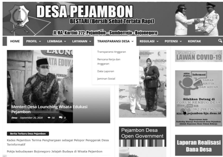
Gambar 3. Website Desa Pejambon diakses 29 Oktober 2020

Transparansi di pemerintah Desa Pejambon dilakukan dengan dua metode, yaitu konvensional dan berbasis TIK. Metode konvensional yang dimaksud seperti memberikan informasi desa melalui baliho. Hal ini perlu dilakukan untuk memfasilitasi masyarakat yang tidak bisa atau belum menguasai TIK dengan baik. Kemudian metode berbasis TIK (website) yang dapat diakses di alamat: pejambon-bjn.desa.id . Upaya ini untuk memfasilitasi masyarakat yang ingin mendapat informasi publik yang disediakan oleh pemerintah Desa Pejambon tanpa harus datang ke balai desa. Keuntungan dari cara ini adalah informasi dapat diakses dimanapun dan kapanpun tanpa dibatasi ruang dan waktu, sehingga masyarakat tidak kesulitan untuk mendapatkan informasi karena dapat diakses secara langsung (Hidayat, 2007; Nugroho, 2003). Berikut ini adalah website pemerintah Desa Pejambon.