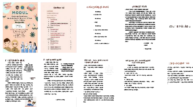
Gambar 2.. Tampilan modul dan isinya

Pada kegiatan 4, atau terakhir terdapat refleksi yang bertujuan untuk mengingat kembali materi yang telah disampaikan kepada peserta didik.