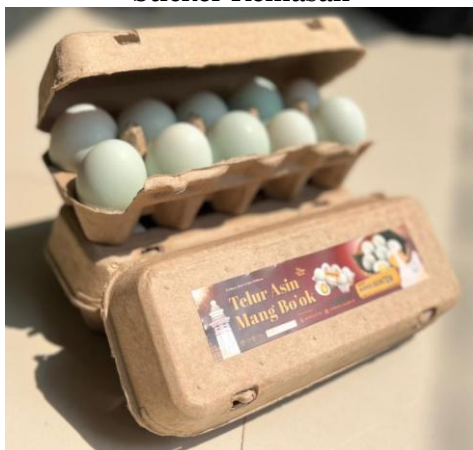
Gambar 8. Rancangan Akhir Kemasan