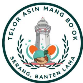
Gambar 3. Final Logo

Warna-warna cerah dan elemen seperti padi, telur, bebek dan juga menara banten lama. Penempatan dua telur asin di latar belakang menegaskan identitas produk yang ditawarkan. Tipografi bergaya sederhana namun tegas digunakan untuk memudahkan keterbacaan dan memberi kesan bersahabat. Logo ini dirancang agar mudah dikenali, mengesankan keaslian produk rumahan, dan memperkuat kesan bahwa produk ini berasal dari tradisi lokal yang khas.