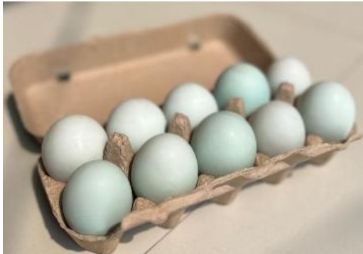
Gambar 6. Kemasan

Kemasan menggunakan bahan kotak karton yang bisa berisi 10 butir telur. Bisa di beli secara daring seharga Rp.1.500. Desain bentuk kotak dilengkapi dengan tutup flip top agar produk lebih aman dan menarik.