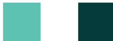
Gambar 4. Warna Logo

Logo Telur Asin Mang Bo'ok didesain secara ilustratif dengan gaya yang khas dan mudah dikenali. Elemen utama dalam logo adalah gambar Mercusuar Banten Lama, sebagai simbol lokalitas dan kebanggaan daerah Serang, serta ilustrasi bebek sebagai ikon dari bahan baku utama produk telur asin. Logo ini dilengkapi dengan ornamen daun, telur asin, dan percikan bintang yang memberi kesan segar, tradisional, dan bersih. Penataan elemen yang simetris serta bentuk lingkaran pada logo memperkuat kesan formal dan kepercayaan terhadap produk. Logo ini secara visual efektif merepresentasikan karakter brand yang ramah, lokal, dan berkualitas.