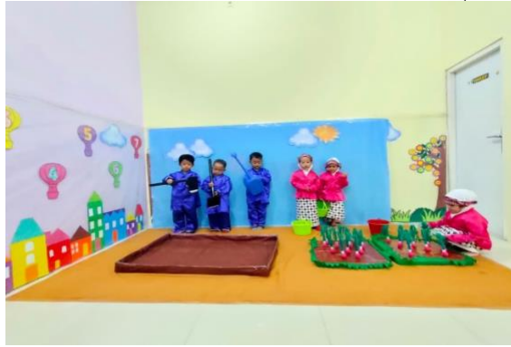
Bermain peran Tanaman yang ada dalam Al Qur'an (bawang merah )