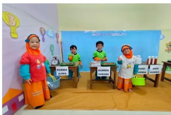
Bermain peran Tanaman yang ada dalam Al Qur'an (kurma)