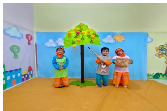
Bermain peran Tanaman yang ada dalam Al Qur'an (delima)