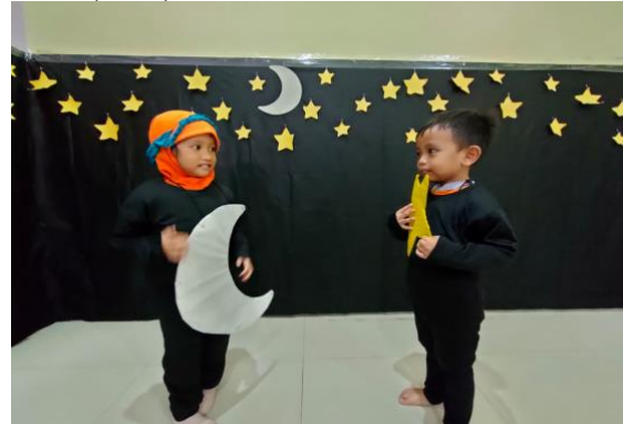
Bermain peran benda langit ciptaan Allah