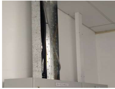
Gambar 2. Tata letak kabel di atas tray atau rak berlubang