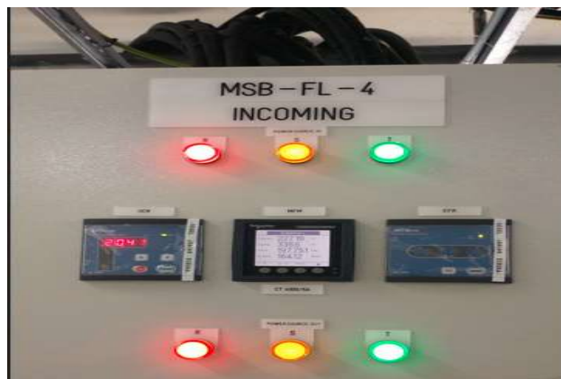
Gambar 5. Sistem proteksi terpasang di panel kubikel

Dengan perhitungan daya terpasang maka diperoleh total daya (P) 2.380.448 W dan arus nominal sebesar 4.526 A, peneliti dapat menentukan setting OCR (Over Current Relay) adalah 2240A/0.5 detik. Sementara nilai EFR (Earth Fault Relay) di set menjadi 100A/0.5 detik. Selanjutnya untuk pemutus sirkuit udara (ACB) dapat digunakan 3P, 5000A/100KA. Rating arus sebesar 5000A merupakan pilihan yang sesuai untuk arus nominal 4526 A pada sistem utilitas. Bilamana arus yang terbaca melebihi 5000A, maka ACB beroperasi untuk memutus arus listrik. Gambar 4 adalah system proteksi terpasang setelah di setting..