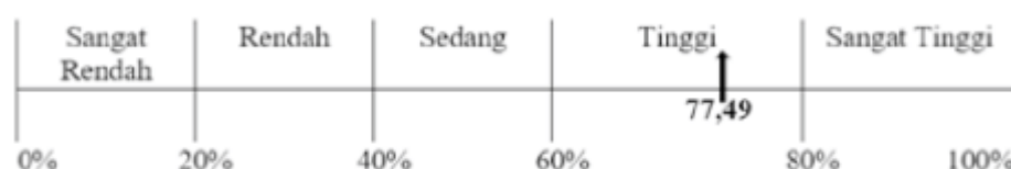
Gambar 1. Garis Kontinum Tingkat Persepsi Petani

Pengkajian ini bertujuan untuk mengetahui seberapa besar persepsi petani tentang pemanfaatan keong mas sebagai POC di Kecamatan Kualuh Selatan Kabupaten Labuhanbatu Utara. Pengkajian ini menyebarkan kuesioner yang berisi pernyataan tentang POC keong mas, yang kemudian diukur dengan skala likert yang disesuaikan dengan kriteria yang ditetapkan. Tingkat persepsi petani terdapat pula pada garis kontinum pada Gambar 1.