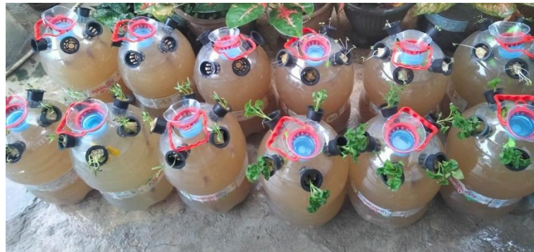
Gambar 3. Penebaran benih lele dan penanaman sayur kangkung, bayam Brazil dan bayam pada budidaya ikan lele dalam galon

Pada penelitian budidaya ikan lele menggunakan sistem akuaponik dalam galon (akudalon) menggunakan beberapa jenis sayuran yaitu kangkung, bayam Brazil dan bayam (Gambar 3). Panen sayuran pertama adalah pada perlakuan P1(kangkung) pada sampling ke-3 atau hari ke-28. Setelah sayuran kangkung dipanen, maka dilakukan penanaman kembali dengan bibit yang baru, sehingga pada minggu ke-5 perlakuan P1(kangkung) dapat dipanen kembali. Pada perlakuan P2 (bayam Brazil) dapat dipanen pada minggu ke-5. Sedangkan perlakuan P3(bayam) tidak ada pemanenan sayur bayam (Gambar 4).