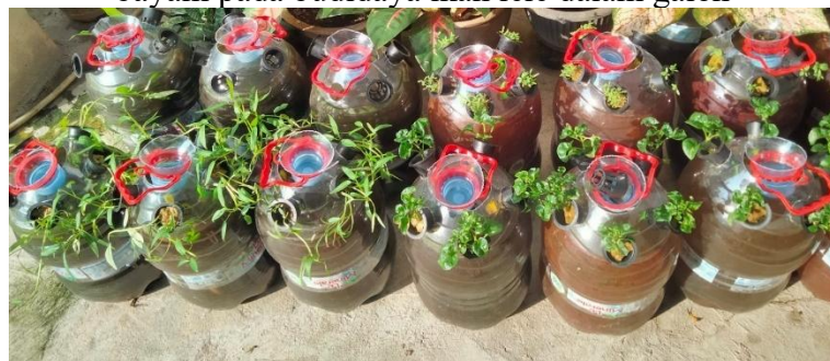
Gambar 4. Pemeliharaan lele dan sayur kangkung, bayam Brazil dan bayam pada budidaya ikan lele dalam galon