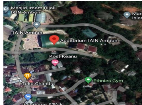
Gambar 2 Lokasi penelitian

Pada penelitian ini objek yang dijadikan sebagai penelitian adalah pada pembangunan gedung auditorium iain kota ambon.