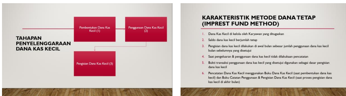
Gambar 3 – Materi Kegiatan Penyuluhan