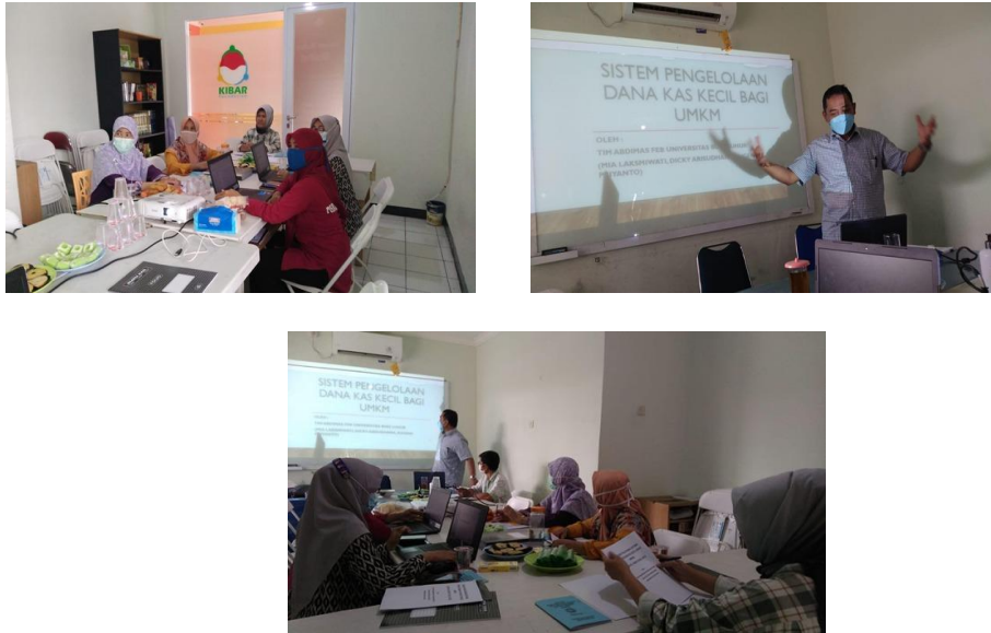
Gambar 2 – Kegiatan Penyuluhan dan Sosialisasi Tentang Tata kelola Dana Kas Kecil Metode Saldo Dana Tetap ( Imprest Fund )