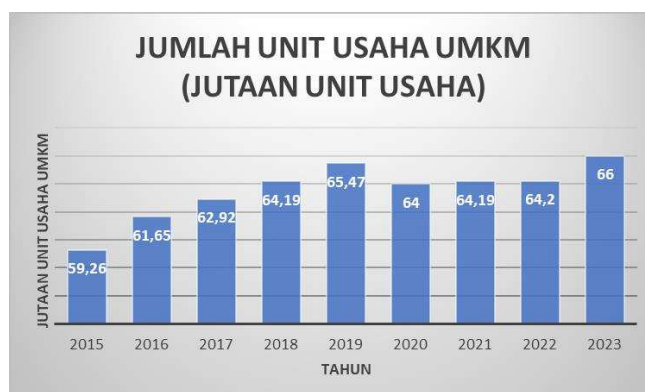
Gambar 1 Perkembangan Jumlah UMKM di Indonesia Tahun 2015-2023

usaha dalam UMKM mampu menyerap banyak tenaga kerja kondisi ini membantu mengurangi jumlah angka pengangguran. Disamping itu UMKM dipercaya dapat memberikan manfaat terhadap pertumbuhan dan peningkatan ekonomi serta pendapatan masyarakat. Kementerian Koperasi dan UKM mencatat sejak tahun 2015 trend jumlah UMKM di Indonesia cenderung mengalami peningkatan dari waktu ke waktu.