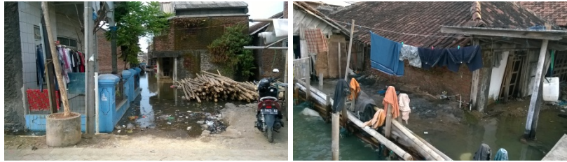
Gambar 8. Rob di Kampung Tambak Lorok

Kerugian yang harus ditanggung oleh nelayan sebagai dampak dari rob dan banjir ini adalah terendahnya rumah yang kemudian membuat barang-barang di dalam rumah menjadi rusak. Barang-barang tersebut antara lain, buku-buku serta alat rumah tangga lainnya. Walaupun begitu, nelayan menjadikan kondisi tersebut sebagai suatu hal yang lumrah dan dianggap sebagai suatu hal yang tidak perlu dikhawatirkan secara lebih. Padahal, selain terendahnya rumah harta kekayaan, dampak lain yang mungkin dapat muncul ialah timbulnya penyakit, hilangnya harta benda, serta kemudian hilangnya pekerjaan dapat menjadi ancaman bagi para nelayan sebagai masyarakat pesisir.