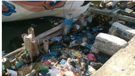
Gambar 5. Pencemaran Laut Oleh Sampah di Kampung Tambak Lorok

Terdapat dua macam musim bagi nelayan, yaitu musim paceklik dan musim panen. Musim yang dikatakan sebagai musim panen merupakan musim banyak tangkapan yang biasanya terjadi pada bulan Januari, Februari, Maret April, Mei hingga Juni serta setelah musim barat. Musim barat yang merupakan musim gelombang serta angin sekitar bulan Januari hingga Maret membuat nelayan kecil lebih memilih untuk istirahat melaut sejenak, menunggu hingga gelombang mereda. Walaupun musim barat berisiko tinggi bagi keselamatan, terkadang nelayan masih berusaha untuk tetap melaut karena hasil yang cukup besar pada musim tersebut. Terutama pada akhir musim barat, ketika gelombang dan angin telah mereda, hasil tangkapan terbilang banyak sehingga disebut sebagai musim panen. Tangkapan yang dihasilkan bisa mencapai Rp 1.000.000,- perhari atau sekitar 5-15 Kg dan bahkan lebih. Pendapatan nelayan perhari hingga Rp 1.000.000. Namun, panen tidak terjadi dalam waktu yang panjang, hanya terjadi satu atau dua hari.