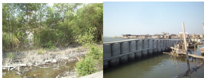
Gambar 2. Kondisi Kerusakan Mangrove di Sekitar Kampung Tambak Lorok

Namun telah ada upaya penanaman kembali mangrove di sekitar kawasan Kampung Tambak Lorok yang dilakukan oleh Dinas Kelautan dan Perikanan, mahasiswa ataupun pihak lain dalam rangka upaya pelestarian lingkungan pesisir. Lokasi penanaman terdapat di bagian paling timur Kampung Tambak Lorok, yaitu di Tambakrejo (RW XVI).