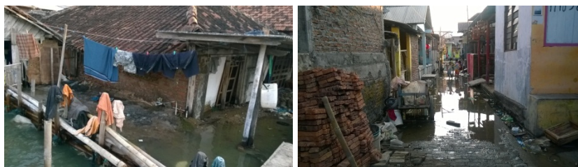
Gambar 6. Kondisi Rumah Nelayan Kampung Tambak Lorok

Status sebagai nelayan yang dinilai dari kalangan menengah kebawah, membuat akses terhadap beberapa fasilitas menjadi terbatas, salah satunya adalah fasilitas perbankan. Syarat yang sulit karena harus melampirkan sertifikat rumah, padahal tidak seluruh nelayan memiliki kondisi rumah yang baik, serta tuntutan angsuran bulanan ke bank membuat nelayan berpikir dua kali untuk menggunakan fasilitas tersebut karena belum memiliki penghasilan yang pasti sehingga sulit bagi nelayan untuk mendapatkan kepercayaan.