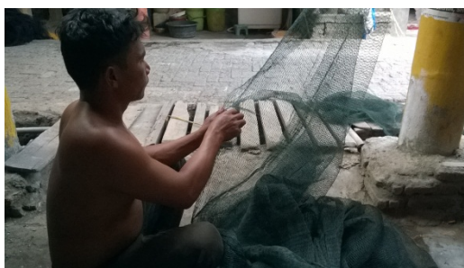
Gambar 7. Alat Tangkap Nelayan di Kampung Tambak Lorok

“Ya jauh, menang yang nelayan besar. Banyak bedanya, soalnya orangnya banyak. Bisa sampai 10 kali lipat. Kan alatnya juga lebih besar, modalnya juga lebih besar. (W1/STRUK/BANDINGHASIL/1)”