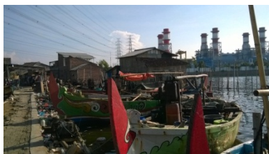
Gambar 4. Lokasi Industri yang berdekatan dengan Kampung Tambak Lorok

“Limbah itu bikin ikan mati, kerang juga mati. Saya berangkat Kamis dapat satu kwintal, Jum’at libur, Sabtu berangkat lagi tapi kerang sudah mati kena limbah. (W4/NAT/PENCEMARAN/3)”