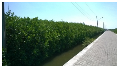
Gambar 3. Kondisi Mangrove yang Tumbuh di Sekitar Kampung Tambak Lorok

“Tidak ada (mangrove), adanya di sebelah sana, di Tambakrejo, sebelah timur sungai. Sebrang sana. (W4/NAT/MANGROVE/1)”