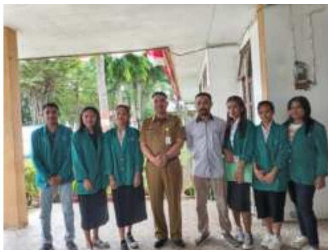
Gambar 2. Komunikasi Tim Kampus Mengajar Bersama Kepala Dinas Pendidikan dan Kebudayaan Kabupaten TTU

Didasari pada surat tugas tersebut tim pengabdian pun melakukan koordinasi untuk mempersiapkan segala sesuatu yang dibutuhkan selama pelaksanaan kegiatan. Berdasarkan hasil koordinasi yang dilakukan tim pengabdian pun bersepakat untuk melakukan komunikasi secara langsung dengan pihak Dinas Pendidikan dan Kebudayaan yang dilaksanakan pada tanggal 16 Februari 2023. Agenda komunikasi antara lain tim pengabdian memperkenalkan diri dan menjelaskan gambaran umum dari kegiatan Kampus Mengajar kepada pihak Dinas Pendidikan dan Kebudayaan Kabupaten Timor Tengah Utara.