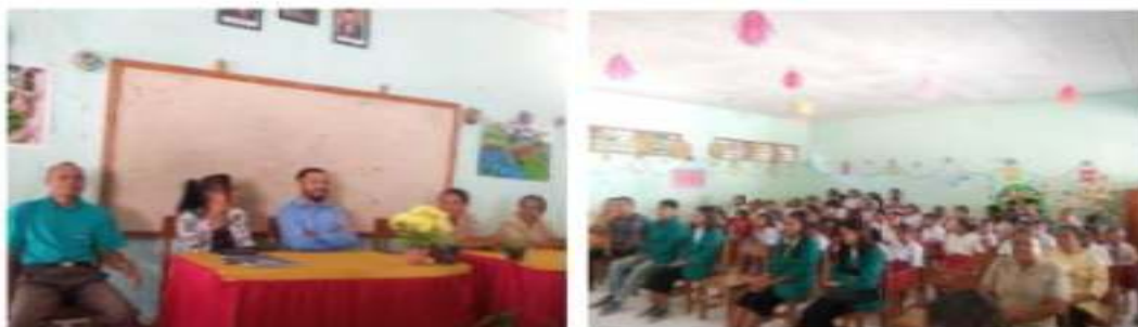
Gambar 12. Evaluasi Program Kerja Sekaligus Temu Pisah

Berbagai kegiatan yang telah dilaksanakan semuanya diarahkan untuk dapat meningkatkan kemampuan literasi dan numerasi peserta didik di SDK Maubesi 2. Hal ini sejalan dengan misi yang Tengah dilaksanakan oleh Kementerian Pendidikan, Kebudayaan Riset dan Teknologi. Program kerja yang dilaksanakan pada akhirnya dievaluasi secara Bersama-sama dengan melibatkan tim pengabdian dan pihak SDK Maubesi 2. Pelaksanaan evaluasi program kerja ini bertujuan untuk menemukan kekurangan dan memperbaikinya dan untuk mengetahui sejauh mana program kerja yang sudah dilaksanakan berdampak secara khusus bagi peserta didik dan pihak SDK Maubesi 2 secara umum. Kegiatan evaluasi dilaksanakan bersamaan dengan temu pisah antara tim pengabdian dengan pihak SDK Maubesi 2 yang diselenggarakan pada hari Jumat 09 Juni 2023.