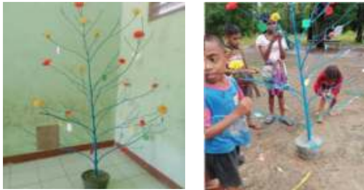
Gambar 5. Pembuatan pohon literasi

berasal dari barang-barang bekas. Kegiatan ini tidak hanya dilaksanakan oleh tim pengabdian tetapi juga melibatkan para guru dan peserta didik, hal ini bertujuan agar menumbuhkan rasa memiliki terhadap hasil kerja mereka (pohon literasi, papan mading dan pojok baca) sehingga mereka dapat menjaga dan memanfaatkannya secara baik. Selain itu pelibatan peserta didik juga bertujuan untuk membangkitkan semangat mereka untuk dapat memanfaatkan barang-barang bekas yang masih dapat digunakan.