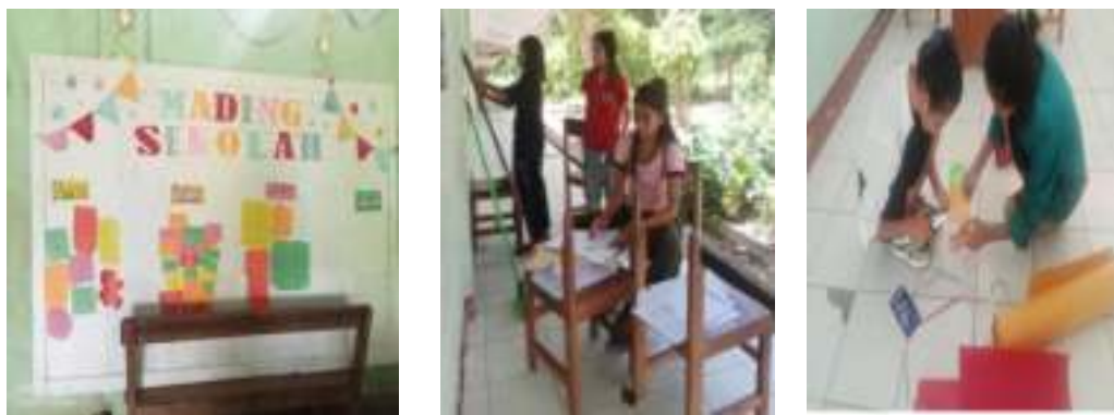
Gambar 6. Pembuatan Papan Mading

Mading adalah majalah dinding yang dipajang dilingkungan sekolah (Mujahidah, et.al: 2024) dan dapat digunakan sebagai media bagi peserta didik untuk menyalurkan ide dan gagasannya melalui karya tulis atau karya seni lainnya.