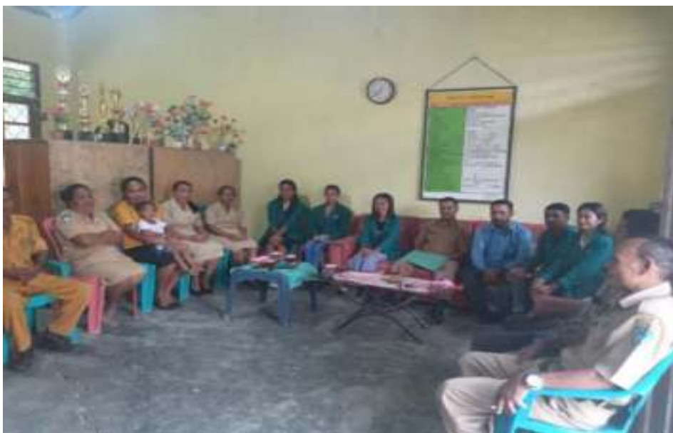
Gambar 3. Lapor diri dan penjelasan rangkaian kegiatan kampus mengajar kepada pihak SDK Maubesi 2

Kegiatan selanjutnya tim membangun komunikasi dengan pihak sekolah dan menyepakati kegiatan lapor diri kepada pihak sekolah sasaran dilaksanakan pada tanggal 20 Februari 2023. Pada kegiatan ini tim kampus mengajar bertemu secara langsung dengan pimpinan SDK Maubesi 2 beserta para guru, untuk memperkenalkan diri dan menjelaskan secara detail tentang rangkaian kegiatan kampus mengajar yang akan dilaksanakan selama 16 pekan.