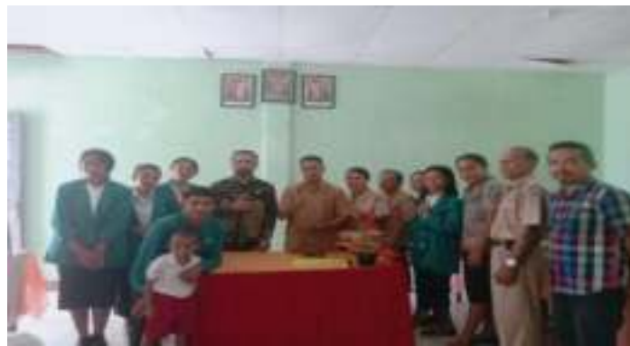
Gambar 4. Kegiatan forum koordinasi/komunikasi antara tim pengabdian dan pihak SDK Maubesi 2

kepercayaan untuk mendampingi peserta didik dalam upaya untuk meningkatkan kemampuan literasi dan numerasi yang dilakukan di dalam maupun di luar kelas (perpustakaan) dan terlibat dalam setiap kegiatan yang dilaksanakan oleh SDK Maubesi 2. Secara teknis kegiatan pendampingan peserta didik dilakukan ketika terdapat guru yang berhalangan dan tidak dapat memberikan pelajaran kepada kelas tertentu maka waktu yang ada diisi oleh mahasiswa untuk mendampingi dan membimbing peserta didik untuk belajar membaca, berhitung dan juga menulis. Program kerja yang disusun oleh tim pengabdian di atas mendapat persetujuan dan diapresiasi oleh pihak sekolah Ketika tim pengabdian menjabarkan pada saat kegiatan koordinasi/komunikasi antara tim pengabdian dan pihak sekolah sasaran.