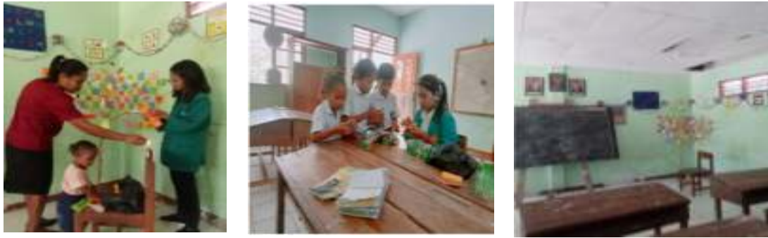
Gambar 7. Pembuatan Pojok Baca