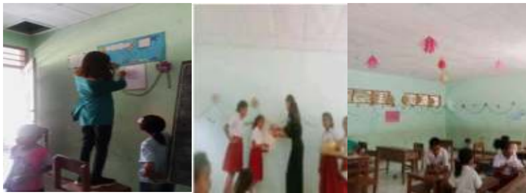
Gambar 8. Penataan Kelas

Kegiatan ini ditujukan untuk menghadirkan suasana kelas dan perpustakaan yang mampu membangkitkan gairah belajar, menciptakan kenyamanan dan perasaan betah untuk belajar dan mengikuti kegiatan pembelajaran. Kegiatan ini juga melibatkan peserta didik dan para guru.