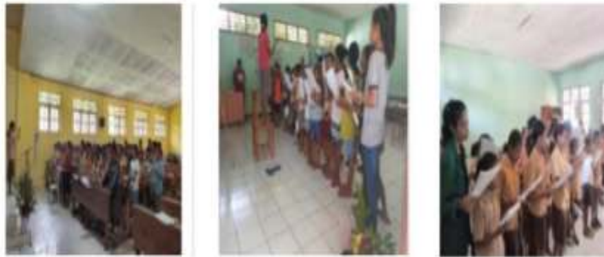
Gambar 11. Keterlibatan dalam Kegiatan Sekolah

Berbagai kegiatan yang telah dilaksanakan semuanya diarahkan untuk dapat meningkatkan kemampuan literasi dan numerasi peserta didik di SDK Maubesi 2. Hal ini sejalan dengan misi yang Tengah dilaksanakan oleh Kementerian Pendidikan, Kebudayaan Riset dan Teknologi. Program kerja yang dilaksanakan pada akhirnya dievaluasi secara Bersama-sama dengan melibatkan tim pengabdian dan pihak SDK Maubesi 2. Pelaksanaan evaluasi program kerja ini bertujuan untuk menemukan kekurangan dan memperbaikinya dan untuk mengetahui sejauh mana program kerja yang sudah dilaksanakan berdampak secara khusus bagi peserta didik dan pihak SDK Maubesi 2 secara umum. Kegiatan evaluasi dilaksanakan bersamaan dengan temu pisah antara tim pengabdian dengan pihak SDK Maubesi 2 yang diselenggarakan pada hari Jumat 09 Juni 2023.