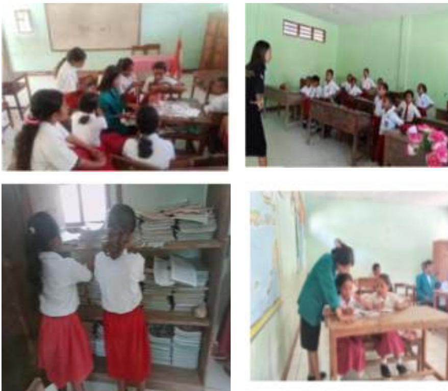
Gambar 10. Pendampingan peserta didik di Kelas dan Perpustakaan

Telah dijelaskan sebelumnya bahwa kegiatan pendampingan dilaksanakan untuk membimbing peserta didik dalam rangka meningkatkan kemampuan literasi dan numerasi baik dilakukan pada saat jam Pelajaran di dalam ruang kelas maupun diluar jam Pelajaran yang dilaksanakan di Perpustakaan. Sedangkan keterlibatan tim pengabdian dalam kegiatan sekolah antara lain terlibat aktif dalam kegiatan persiapan dan pelaksanaan koor/Paduan suara yang ditampilkan di Gereja, persiapan dan pelaksanaan upacara bendera yang dilaksanakan setiap hari senin dan pada saat peringatan Hari Pendidikan Nasional.