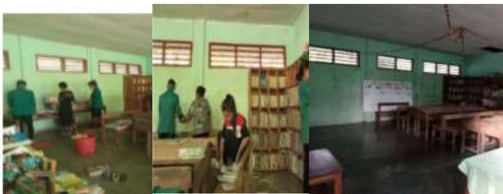
Gambar 9. Penataan Perpustakaan