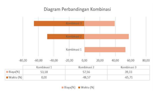
Gambar 3. Diagram Perbandingan Kombinasi

Diagram di atas menyajikan perbandingan dari ketiga kombinasi berdasarkan efisiensi biaya dan percepatan waktu kerja. Dapat dilihat bahwa Kombinasi 3 memberikan percepatan waktu paling signifikan yaitu sebesar 65,71%, dengan kenaikan biaya sewa alat berat sebesar 39,33%. Sehingga berdasarkan perbandingan kombinasi dari segi waktu dan biaya, Kombinasi 3 merupakan pilihan yang paling optimal, karena mampu memberikan percepatan waktu kerja paling besar dengan biaya yang relatif lebih rendah dibandingkan dengan kombinasi lainnya.