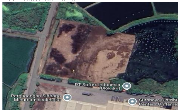
Gambar 1 Lokasi Penelitian