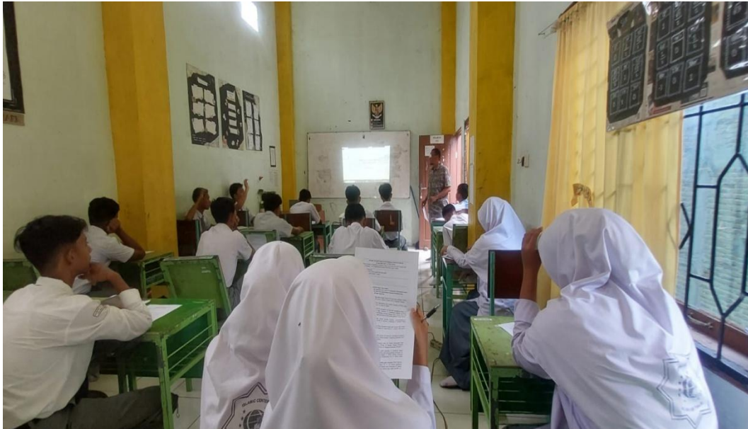
Gambar 5. Pelaksanaan Post Test