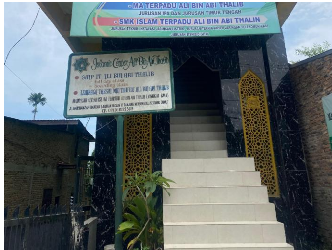
Gambar 1. Plang Depan MA Terpadu Ali Bin Abi Tholib Tanjung Morawa

berkerja sehingga keberadaan sekolah seperti MA Terpadu Ali Bin Abi Tholib yang berkonsep full day (sehari penuh) cukup diminati oleh masyarakat di sana. Jumlah peminat sekolah ini setiap tahunnya meningkat.