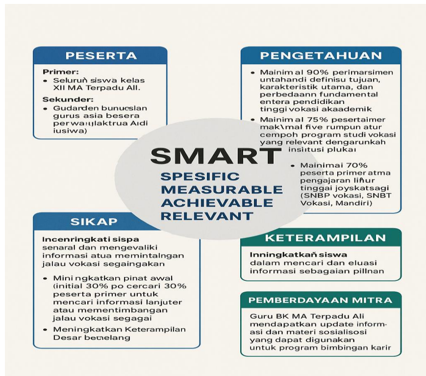
Gambar 3. Target Kegiatan dalam Model SMART : Specific, Measurable, Achievable, Relevant, Time-bound