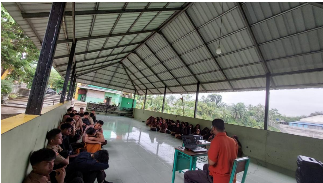
Gambar 1. Diskusi Interaktif

Siswa yang awalnya pasif menjadi aktif bertanya dan berdiskusi. Beberapa siswa meminta kontak narasumber untuk konsultasi lanjutan.