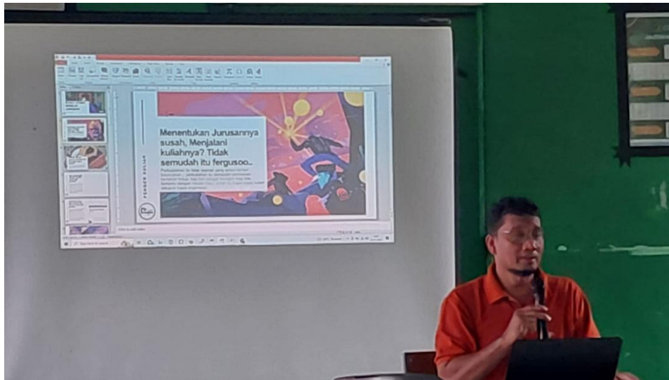
Gambar 7. Pemaparan presentasi Vokasi Jalur Cerdas Menuju Karir Profesional

profil institusi, dan contoh proyek mahasiswa efektif menggugah minat siswa. Informasi mengenai SNBP Vokasi, SNBT Vokasi, serta program KIP Kuliah banyak ditanyakan.