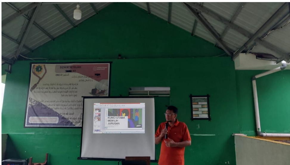
Gambar 6. Pemaparan Materi Presentasi

Respon terhadap Materi Sesi 1: “ Mengapa Harus Melanjutkan Ke Jenjang Perguruan Tinggi”. Materi mengenai pentingnya melanjutkan ke jenjang Perguruan Tinggi yang juga dikaitkan dengan Perpres No. 68 Tahun 2022 memberikan perspektif baru kepada siswa. Diskusi tentang prinsip “ learning by doing ” sangat menarik perhatian.