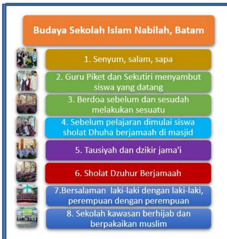
Gambar 3. Budaya Sekolah Islam Nabilah

Budaya sekolah yang diterapkan di Sekolah Islam Nabilah Batam, khususnya di SMP dan SMA sudah cukup baik. Budaya sekolah merupakan pembiasaan-pembiasaan yang mencerminkan visi-misi sekolah yang teraplikasi dan tampak pada perbuatan warga sekolah, siswa, tenaga pendidik dan kependidikan.