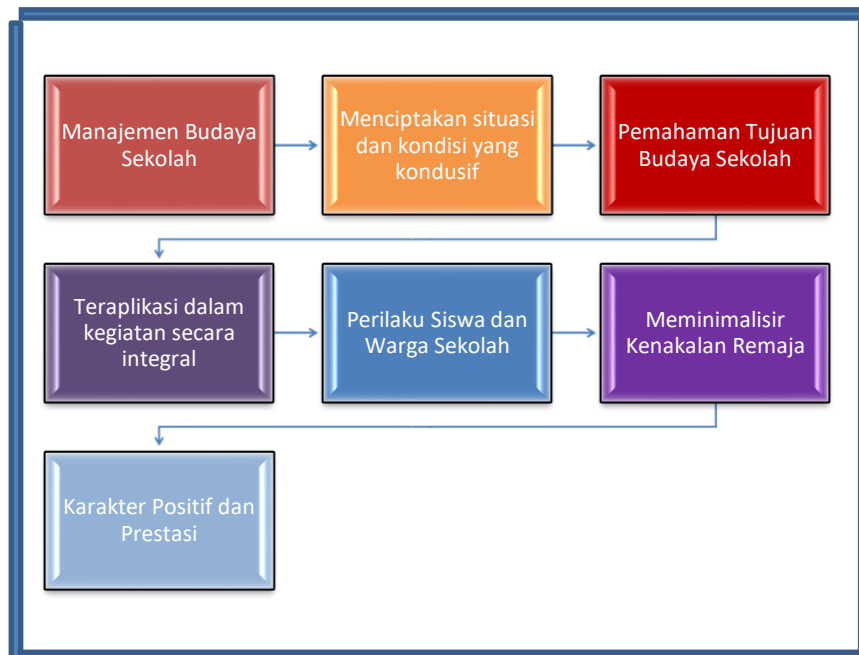
Gambar 1. Skema Tujuan Manajemen Budaya Sekolah dalam Meminimalisir Kenakalan Remaja di SMP dan SMA Islam Nabilah Batam

Salah satu perilaku kenakalan remaja yang umum adalah merokok, yang terjadi tanpa memandang jenis kelamin, yang sering dilakukan luar sekolah, mereka bersama teman-teman, bahkan saat masih mengenakan seragam jika berkumpul dalam kelompok besar. Remaja millennial atau yang juga dikenal sebagai digital native adalah generasi remaja yang dibesarkan di era digital, (Zhafira, 2028).