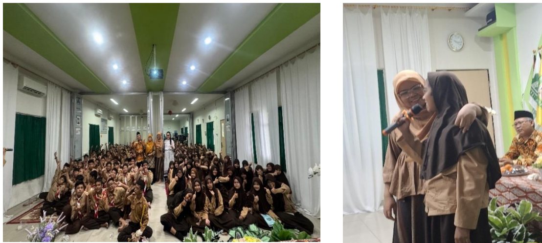
Gambar 4. Pelaksanaan Sosialisasi Manajemen Budaya Sekolah