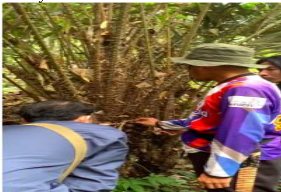
Gambar 6. Proses Memanen Salak

Tahap implementasi dilaksanakan dengan meninjau langsung kebun salak bersama mahasiswa KKM 58 serta dosen pendamping. Mahasiswa ikut serta dalam menyiapkan bahan baku yaitu salak Sasahan.