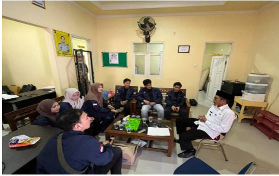
Gambar 5. Proses Administrasi