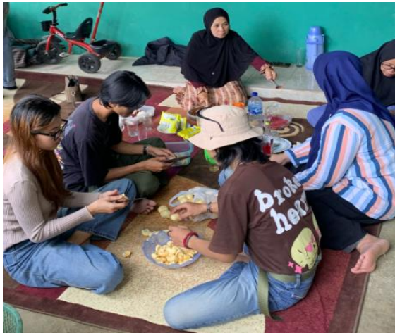
Gambar 8. Praktek pembuatan asinan salak bersama masyarakat

Tahapan implementasi diakhiri dengan proses pengemasan. Proses pengemasan asinan salak Sasahan dilakukan dengan memperhatikan aspek kebersihan, kerapian dan estetika guna membangun citra merek yang menarik. Asinan salak yang telah jadi kemudian dikemas dengan menggunakan wadah tertutup rapat untuk menjaga kesegaran dan kualitas produk. Label produk disertakan dengan mencerminkan identitas lokal, informasi komposisi, tanggal produksi, serta logo merek “Salak Sasahan” sebagai olahan khas daerah. Upaya ini tidak hanya bertujuan untuk menarik minat konsumen, tetapi juga memperkuat daya saing produk di pasaran dengan menghadirkan kesan modern namun tetap mengangkat kearifan lokal.