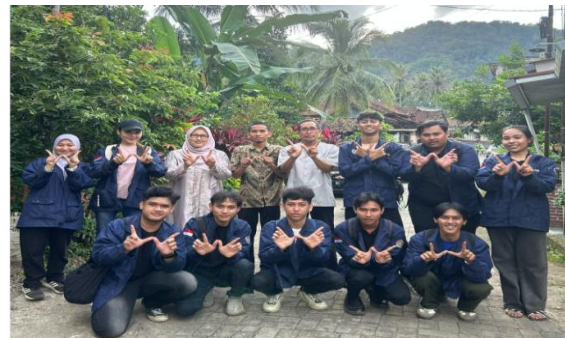
Gambar 4. Survei Lokasi Pengabdian

Selanjutnya, pada tanggal 22 April 2025 mengunjungi kantor Desa Sasahan-Waringinkurung dalam rangka menyelesaikan proses administratif, sebagai proses formal untuk melegitimasi tindakan yang menunjukkan pengabdian kepada masyarakat; dan merencanakan kegiatan utama untuk memenuhi kebutuhan mitra serta menyelesaikan masalah.