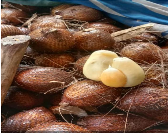
Gambar 3. Salak Sasahan

Alternatif pengolahan salak menjadi produk olahan seperti keripik, dodol, atau sirup dapat memperpanjang masa simpan dan meningkatkan nilai jual produk tersebut. Namun, pengembangan produk olahan di Desa Sasahan masih menghadapi berbagai kendala, mulai dari keterbatasan pengetahuan teknologi pengolahan hingga minimnya akses terhadap pasar yang lebih luas. Selain itu, belum optimalnya citra merek produk olahan salak juga menjadi hambatan dalam meningkatkan daya saing produk di tingkat regional maupun nasional (Sari, 2019).