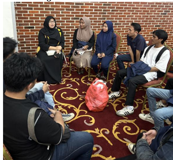
Gambar 10. Evaluasi Kegiatan

Tahap akhir yaitu mengevaluasi kegiatan yang akan secara keseluruhan, tahap ini dilakukan evaluasi melalui wawancara pada masyarakat yang telah mengikuti praktek pembuatan asinan sasahan. Adapun hasil yang didapat yaitu pernyataan pengetahuan pengembangan alternatif potensi lokal menjadi meningkat serta pemahaman akan pentingnya identitas merek dalam pemasaran. Kemudian laporan akhir dibuat dalam penulisan artikel yang diseminarkan pada Seminar Nasional Pengabdian Masyarakat yang di adakan oleh LPPM Universitas Serang Raya pada tanggal 2 Juli 2025.