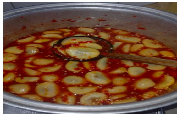
Gambar 7. Hasil uji coba pembuatan asinan salak sasahan

Tahap implementasi yakni melakukan pengembangan alternatif olahan salak Sasahan dilaksanakan oleh divisi UMKM KKM kelompok 58 dengan diawali uji coba bersama praktisi bidang kuliner "Dapur Salman" pada tanggal 23 Mei 2025. Praktik uji coba pembuatan asinan salak mendapatkan hasil yaitu bahan-bahan yang dipakai dalam pembuatan asinan salak sasahan dan proses pembuatan asinan salak. Bahan-bahan yang diperlukan yaitu salak yang telah di kupas, gula putih, garam, dan cuka. Sedangkan proses pembuatan asinan salak dilakukan oleh mahasiswa yang langsung didampingi ibu Ifah. Tahapan proses diantaranya, diawali dengan pembersihan buah salak dari kulitnya, kemudian di cuci bersih dan ditiriskan. Langkah selanjutnya semua bumbu dihaluskan menggunakan blender sampai halus kemudian masukkan kedalam rebusan air mendidih setelah itu langkah selanjutnya masukkan salak yang telah bersih kedalam rebusan air tersebut.