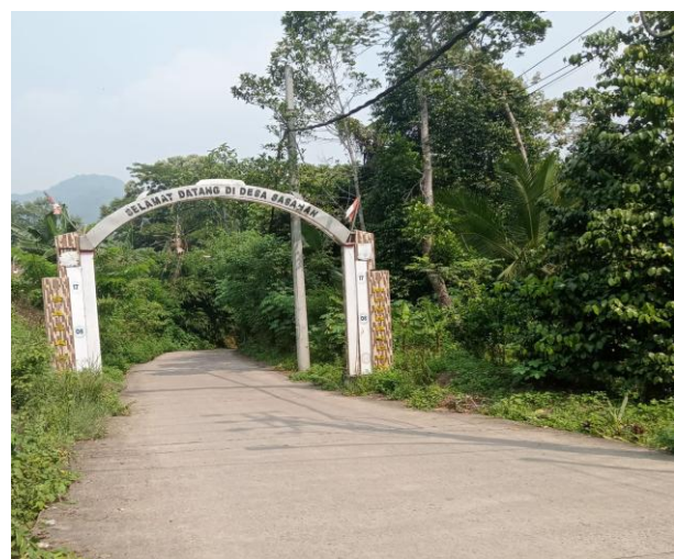
Gambar 2. Akses masuk Desa Sasahan