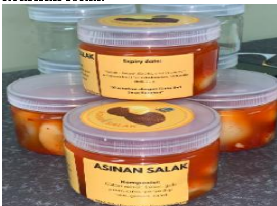
Gambar 9. Hasil Pengabdian “Asinan Salak Sasahan”

Tahapan implementasi diakhiri dengan proses pengemasan. Proses pengemasan asinan salak Sasahan dilakukan dengan memperhatikan aspek kebersihan, kerapian dan estetika guna membangun citra merek yang menarik. Asinan salak yang telah jadi kemudian dikemas dengan menggunakan wadah tertutup rapat untuk menjaga kesegaran dan kualitas produk. Label produk disertakan dengan mencerminkan identitas lokal, informasi komposisi, tanggal produksi, serta logo merek “Salak Sasahan” sebagai olahan khas daerah. Upaya ini tidak hanya bertujuan untuk menarik minat konsumen, tetapi juga memperkuat daya saing produk di pasaran dengan menghadirkan kesan modern namun tetap mengangkat kearifan lokal.