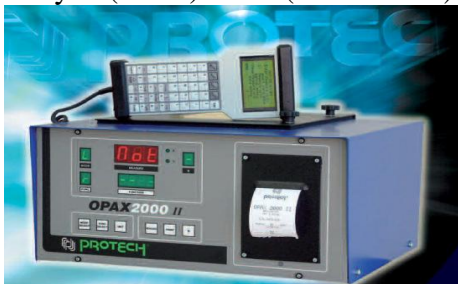
(Gambar 4 : OPAX 2000 II SMOKEMETER)

Digunakan untuk Alat Uji Emisi Gas Buang kendaraan bermotor roda empat (4) atau lebih yang menggunakan Bahan Bakar Minyak (BBM) Solar ( Diesel Fuel ).