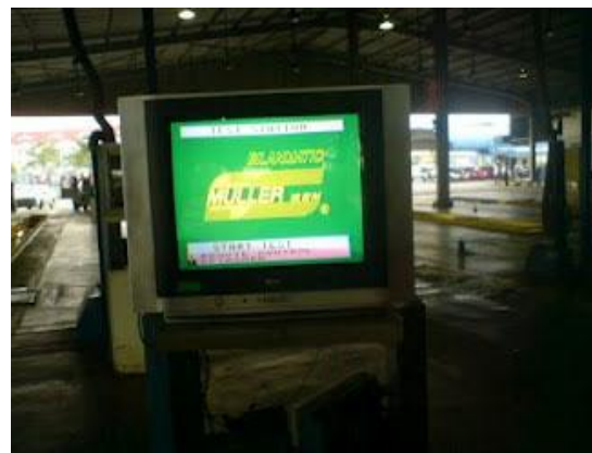
(Gambar 3 : MULLER BEM Gas Analyzer 8701-G )

Digunakan untuk Alat Uji Emisi Gas Buang kendaraan bermotor roda empat (4) atau lebih yang menggunakan Bahan Bakar Minyak (BBM) Bensin ( Gasoline Fuel ). Sistem pengambilan data di alat uji ini kendaraannya harus dalam keadaan menyala mesinnya, tanpa ada diinjak pedal gas kendaraan tersebut, tanpa ada penggunaan porseneleng (porseneleng netral), dan dalam keadaan berhenti. Peletakkan switch (alat penghubung) sensor Alat Uji Emisi Gas Buang dengan Gas Buang Kendaraan diletakkan dilubang knalpot kendaraan tersebut. Setelah itu sistem pendataan dikomputer akan bekerja sesuai data uji emisi gas buang kendaraan yang diterima oleh sensor alat uji emisi gas buang tersebut. Pendataan akan dikeluarkan pengukuran untuk volume CO, CO.c, CO 2 , HC, O 2 , LAMBDA, OIL, mV LAMBDA, RPM motor.