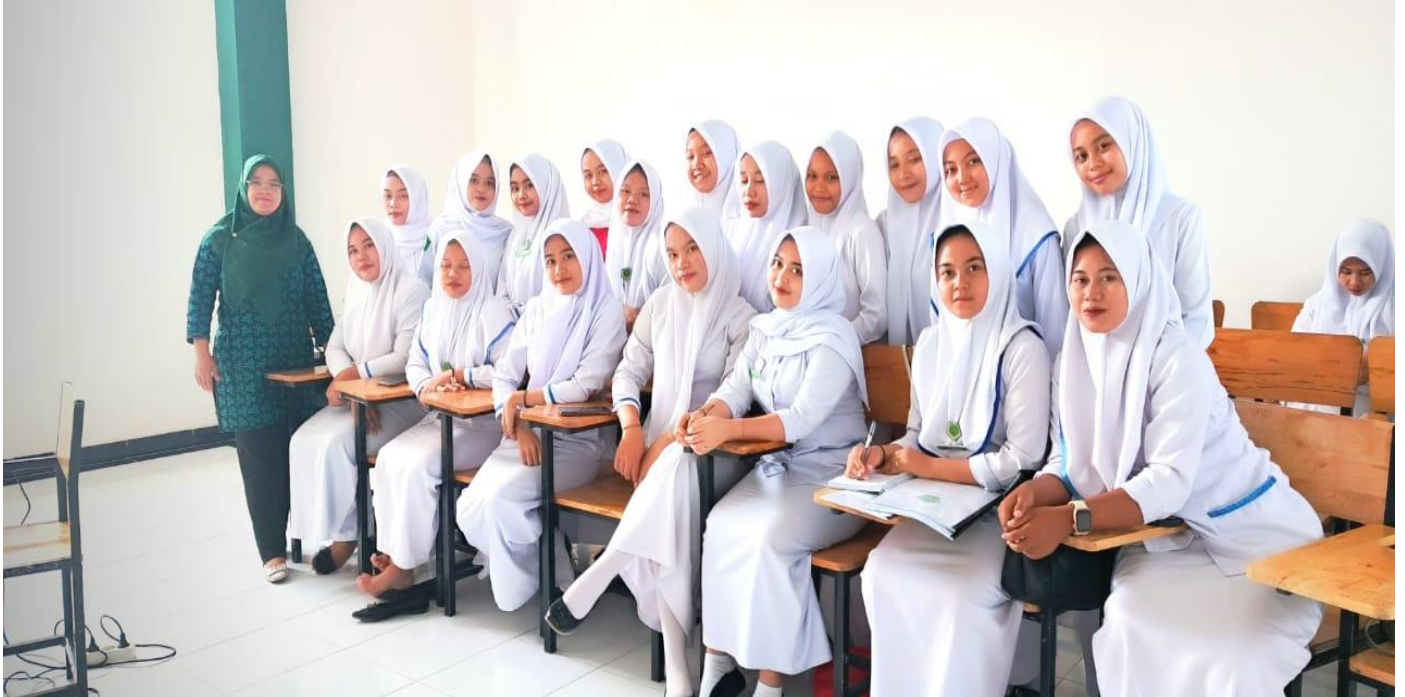
Gambar 2. Penyampaian Materi Pelatihan Bersama Mahasiswi STIKes As Syifa Kisaran