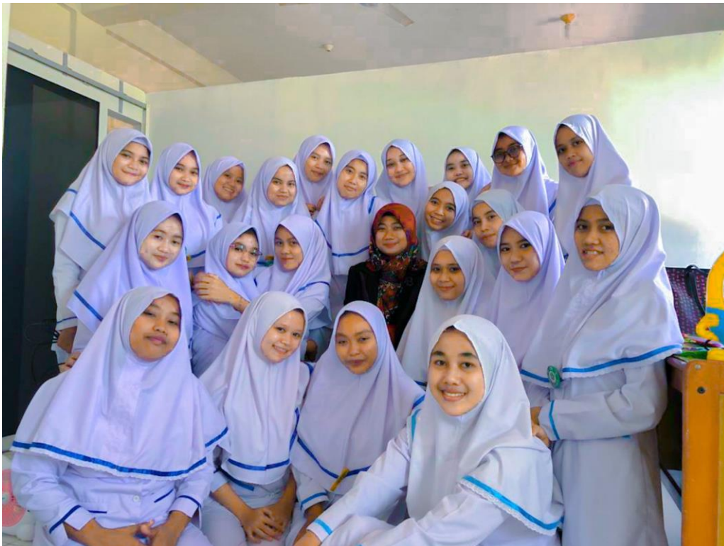
Gambar 1. Penyampaian Materi Pelatihan Bersama Mahasiwi

Evaluasi dilakukan yaitu dengan memberikan kesempatan tanya jawab kepada para peserta yang kurang mengerti atau memahami isi materi yang berkaitan dengan protokol kesehatan.