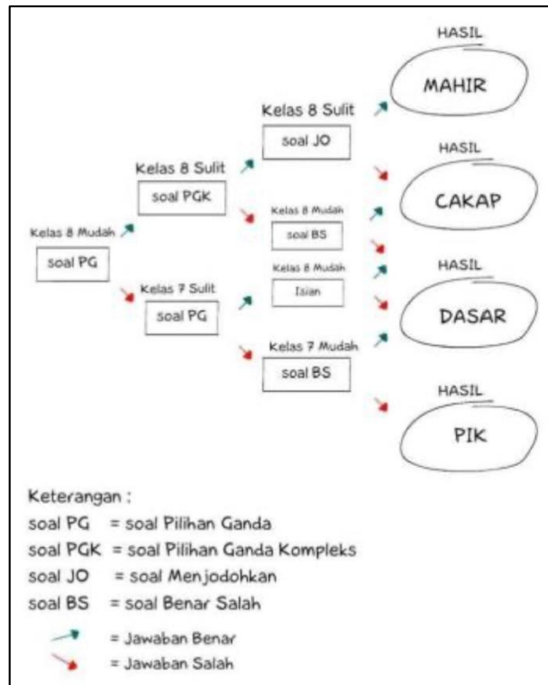
Gambar 2. Peta Klasifikasi Asesmen Berbasis Kearifan Lokal

Aplikasi telah dikembangkan pada tahap “ Develop” kemudian di uji keterbacaanyaserta di uji validitasnya. Gambar 3 menunjukkan salah satu cuplikan Asesmen yang telah dikembangkan dalam aplikasi android.