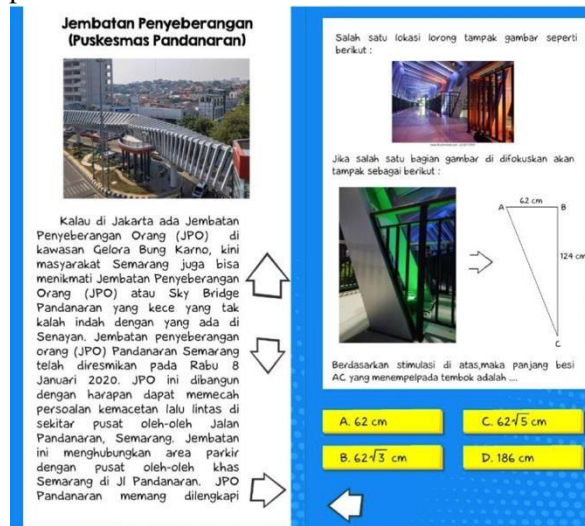
Gambar 3. Cuplikan tampilan Aplikasi Android

Aplikasi telah dikembangkan pada tahap “ Develop” kemudian di uji keterbacaanyaserta di uji validitasnya. Gambar 3 menunjukkan salah satu cuplikan Asesmen yang telah dikembangkan dalam aplikasi android.