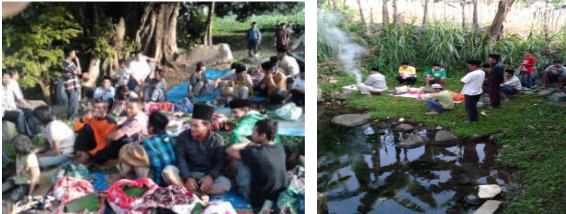
Sumber: Santosa, 2012

babat alas Desa Petungsewu, sehingga bisa dikatakan tempat ini awal atau (tempat) kelahiran. Mbelik merupakan sumber mata air yang menjaga kehidupan, sehingga bisa diartikan tempat ini sebagai pejaga-pemelihara. Kramat Rondo Kawak dan Rondo Kuning, yang menurut sejarahnya adalah merupakan istri-istri dari para pendiri desa, bisa diartikan sebagai pendamping dan penyelaras kehidupan, sedangkan kramat Mbah Toto adalah simbol kematian.