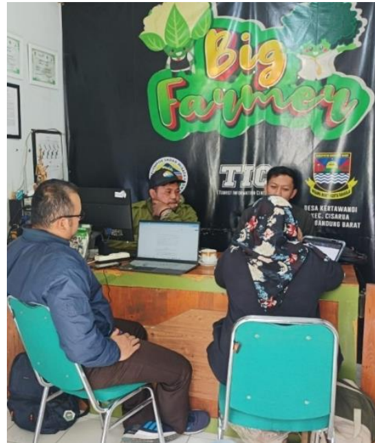
Gambar 6. Kegiatan Peninjauan Konten

Penyerahan kedua produk disertai dengan acara sosialisasi yang bertujuan untuk menjelaskan mengenai konten yang dimuat di dalam produk dan cara pemanfaatannya untuk kepentingan promosi. Kegiatan dilaksanakan pada tanggal 17 September 2024 dengan dihadiri oleh tim PkM Jurusan Bahasa Inggris Polban, ketua dan anggota POKDARWIS, serta Kepala Desa Kertawangi. Ketua POKDARWIS menyatakan puas dengan kedua produk tersebut, dan Kepala Desa Kertawangi menyatakan bahwa produk ini akan sangat membantu desa serta program Big Farmer untuk menjaring wisatawan asing untuk berkunjung.