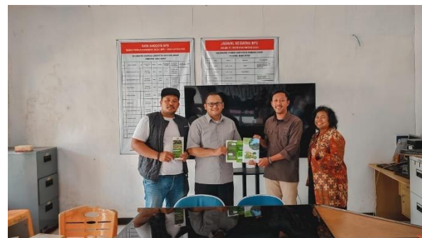
Gambar 7. Kegiatan Sosialisasi dan Penyerahan Produk Akhir untuk POKDARWIS Desa Kertawangi

Tidak terdapat kendala yang berarti dalam penyelesaian proyek Pengabdian kepada Masyarakat ini. Pemerintah Desa Kertawangi dan tim POKDARWIS sebagai mitra memberikan respon yang sangat baik dan bantuan yang dibutuhkan dalam penyelesaian kedua produk media promosi.