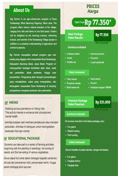
Gambar 5. Bagian Brosur yang Ditulis dalam Dua Bahasa