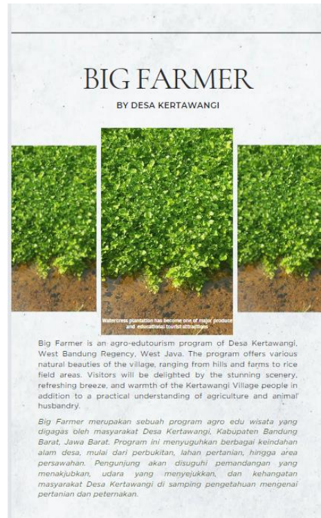
Gambar 4. Bagian Program Profil yang Ditulis dalam Dua Bahasa

konteks budaya antara bahasa sumber dan target, meningkatkan daya tarik dan pemahaman audiens .