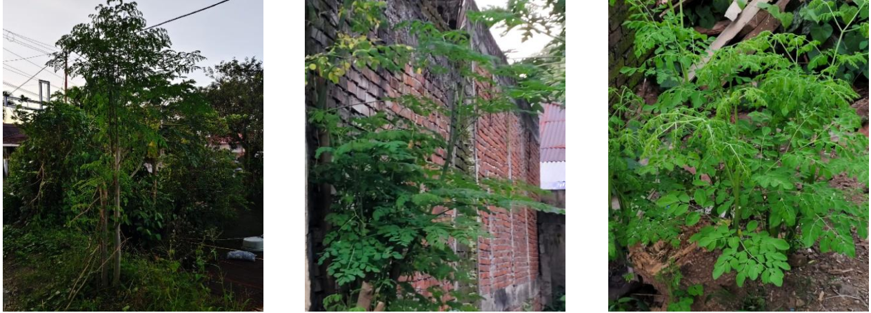
Gambar 1. Tanaman Kelor sebagai tanaman pagar.

Permasalahan tersebut membuat kami tertarik untuk melakukan PKM pelatihan pembuatan pupuk organik cair daun kelor dan aplikasi pada tanaman pakchoy pada kelompok PKK Desa Wolaang Kecamatan Langowan Timur yang bertujuan untuk mengedukasi kelompok PKK tentang penggunaan pupuk organik cair dari bahan daun kelor yang mudah didapat dan banyak tersedia di lingkungan mereka. Selain itu penggunaan pupuk organik daun kelor relatif lebih murah dan mengurangi penggunaan pupuk dari bahan kimia berbahaya yang mencemari lingkungan.