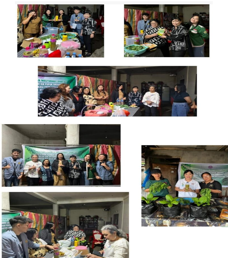
Gambar 2. Tim PKM Memberikan Penyuluhan Kepada Kelompok PKK di Desa Wolaang Kecamatan Langowan Timur.