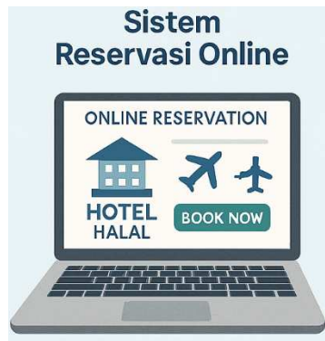
Gambar 2. Sistem reservasi online