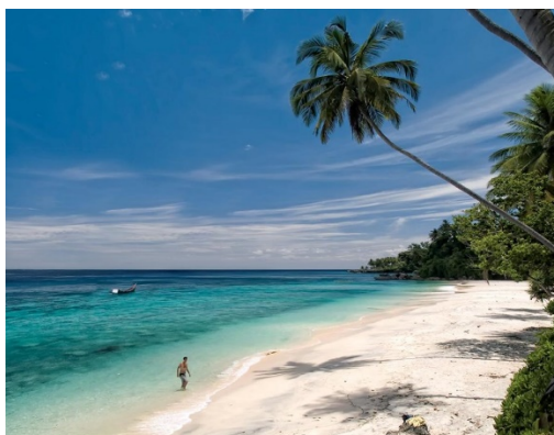
Gambar 2. Pantai Sumur Tiga