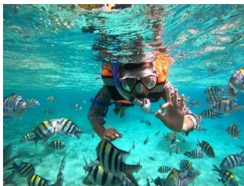
Gambar 4. Pulau Rubiah taman laut

Strategi komunikasi digital terbukti efektif dalam memperkenalkan wisata halal Sabang[7]. Promosi melalui Instagram, TikTok, dan YouTube menampilkan keindahan alam dengan narasi halal. Kolaborasi dengan influencer Muslim memperluas jangkauan promosi hingga ke mancanegara. Materi promosi multibahasa juga membantu menjangkau wisatawan internasional.