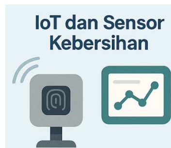
Gambar 3. IoT dan sensor untuk monitoring kebersihan destinasi