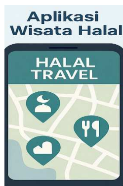
Gambar 1. Aplikasi Wisata Halal