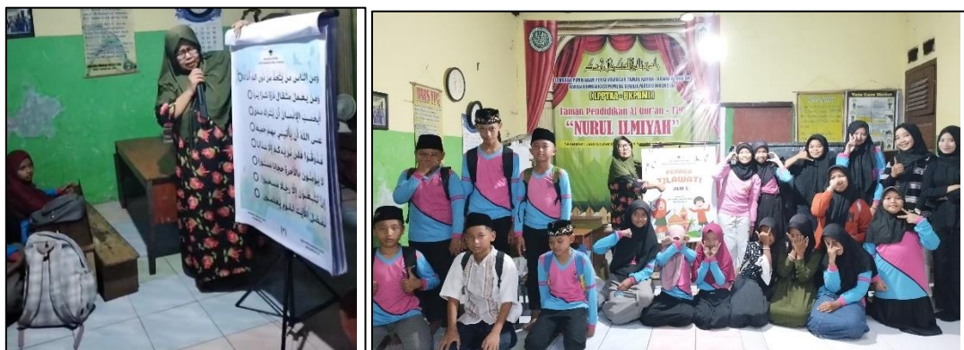
Gambar 2. Implementasi Media Pembelajaran pada Kelompok Tilawati Jilid 5

Media pembelajaran yang telah didesain kemudian di uji coba terbatas antara tim dan pendidik. Hal ini dilakukan untuk mempersiapkan pendidik mengenai cara penggunaan media dan langkah pembelajaran yang didesain untuk media tersebut. Setelah uji coba terbatas dilakukan, selanjutnya adalah implementasi media pembelajaran kepada santri.