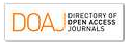
Directory of Open Access Journals