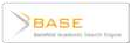
Bielefeld Academic Search Engine