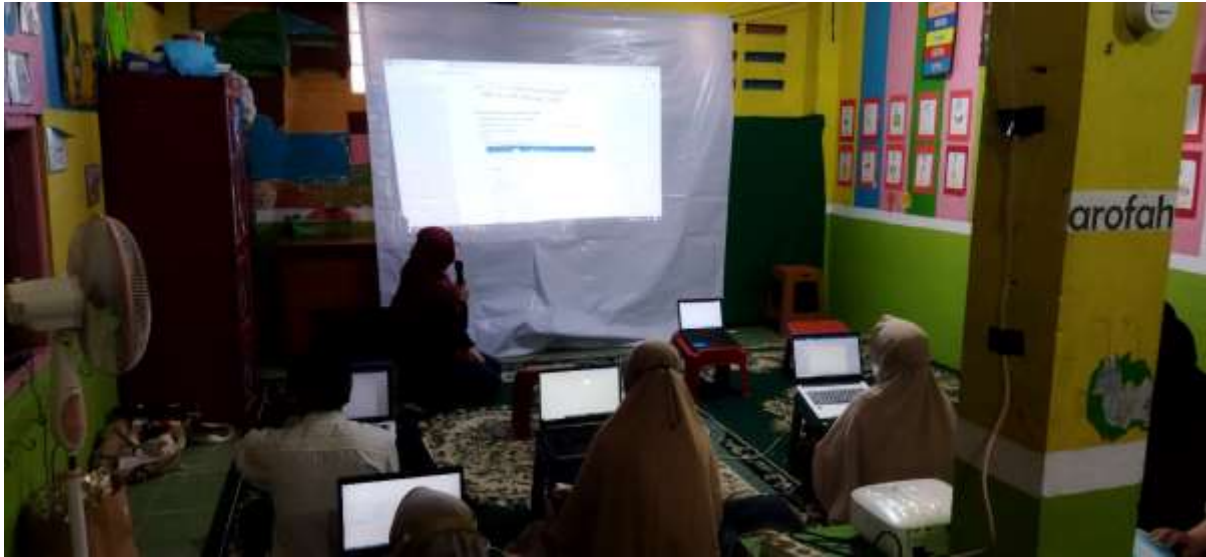
Gambar 1. Pembukaan Pengabdian Masyarakat