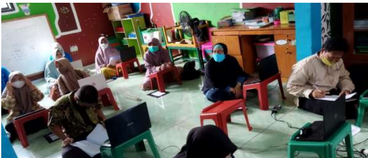
Gambar 2. Pelatihan dimulai