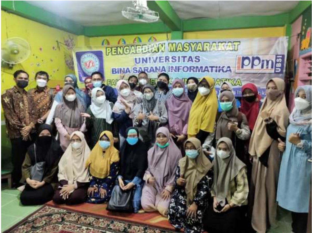
Gambar 3. Foto Bersama