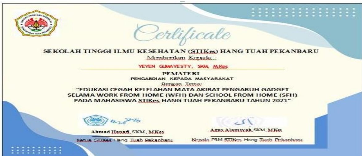
Gambar 3. Sertifikat Pemateri