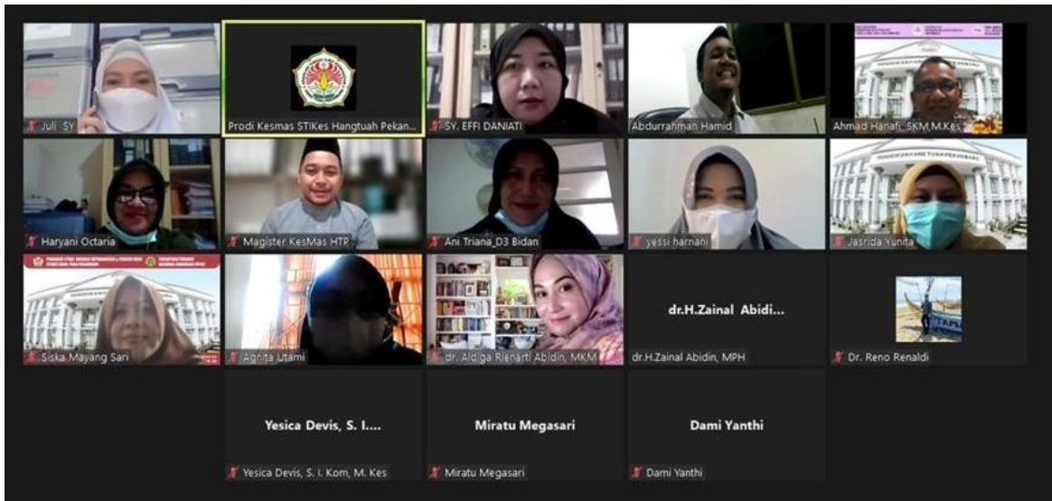
Gambar 2. Pemberian Materi Pada Dosen

Pada tabel 7 terlihat bahwa peserta yang mengalami kelelahan mata menunjukkan bahwa terdapat sebanyak 31 orang (88,6 %) yang mengalami satu atau lebih keluhan subjektif kelelahan mata dan sebanyak 4 orang (11,4%) yang tidak mengalami kelelahan mata. Dari hasil dan pembahasan kegiatan pengabdian masyarakat yang dilakukan oleh tim pengabdian kepada mahasiswa dan dosen Universitas Hang Tuah Pekanbaru maka dengan ini dilampirkan dokumentasi kegiatan tersebut seperti dibawah ini: