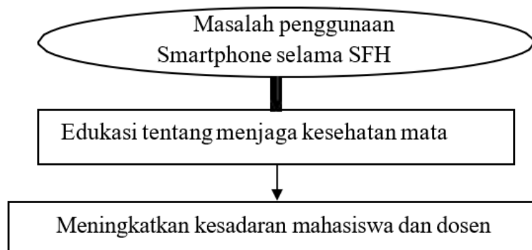
Gambar 1. Kerangka Pemecahan Masalah

Kerangka Pemecahan masalah dalam pengabdian kepada masyarakat dapat digambarkan sebagai berikut: