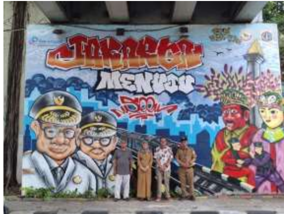
Gambar 14. Anggota tim pengabdian bersama mitra melakukan peresmian karya