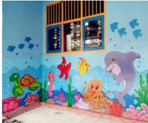
Gambar 2. Ilustrasi karya seni mural di tembok sekolah

Secara etimologis, graffiti berasal dari bahasa Italia yaitu " graffire ", yang dapat diartikan sebagai proses menggambar atau menulis huruf di permukaan yang keras seperti dinding (Saputra, Sulaiman, & Nuryati, 2024). Selain itu, ditemukan pendapat lain bahwa kata graffiti menurut Mikke Susanto berasal dari bahasa Italia " graffito " yang berarti goresan atau guratan (Carollina, 2017). Biasanya graffiti ditampilkan dalam bentuk gambar karakter atau teks inisial seniman graffiti, yang pada umumnya hanya dipahami oleh sesama seniman graffiti (Aulia, Wanis, Tiyas, & Sumarwahyudi, 2023). Apabila ditinjau secara mendalam dari segi visual, karya graffiti menggunakan berbagai elemen rupa seperti garis, bentuk, ilustrasi, dan warna, yang turut membentuk bagaimana karya-karya yang dihasilkan dalam wujud graffiti menjadi beragam karya yang memiliki gaya bahasanya masing-masing (Carollina, 2023).