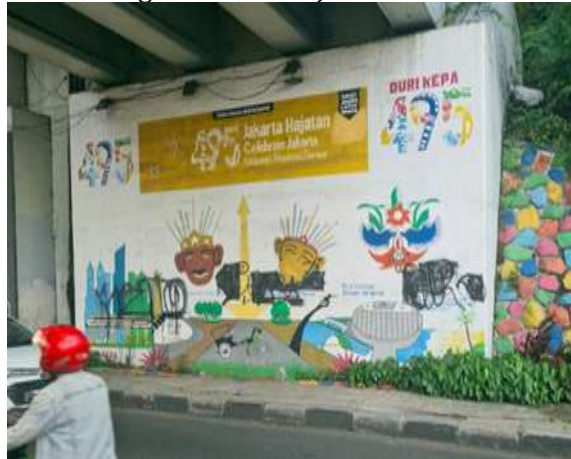
Gambar 4. Tampak panel tembok berukuran 7x6 meter di lokasi sasaran pengabdian

Seperti yang terlihat di salah satu panel tembok berukuran besar di wilayah Kelurahan Duri Kepa Kota Jakarta Barat, yang mana sebelumnya menjadi media untuk melukis karya seni mural telah menjadi sasaran vandalisme oleh pihak yang tidak bertanggungjawab. Mengacu kepada pernyataan Deputi IV Kepala Staf Kepresidenan Juri Ardiantoro pada tahun 2021 lalu, sebenarnya pembuatan seni visual jalanan itu tidak dilarang selama tema dan konten gambarnya tidak mengganggu kenyamanan masyarakat, tidak menyinggung pribadi masyarakat, tidak mengandung pesan negatif, dan tidak mengandung SARA. Dilandasi oleh fenomena tersebut, dapat teridentifikasi bahwa permasalahan prioritas pihak Mitra yaitu Kelurahan Duri Kepa Kota Jakarta Barat adalah terkait karya seni mural yang telah menjadi sasaran vandalisme dan dianggap membosankan oleh masyarakat setempat, sehingga wajib diperbarui sesuai tema Jakarta Menuju 5 Abad bersamaan dengan HUT Kota Jakarta ke-498 di tahun 2025 ini.