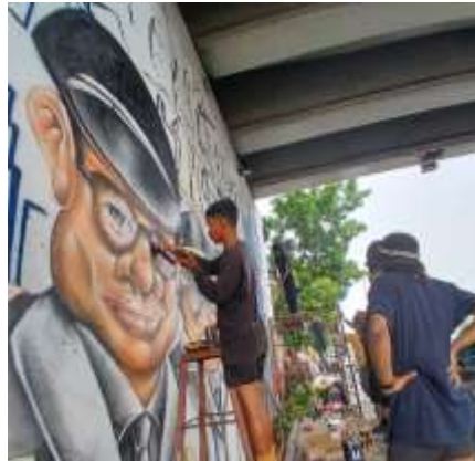
Gambar 10. Anggota tim mahasiswa dan tim eksternal melakukan pewarnaan detail