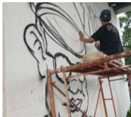
Gambar 8. Anggota tim mahasiswa membuat sketsa dasar sesuai konsep