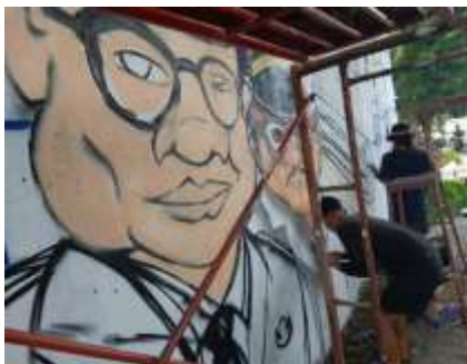
Gambar 9. Anggota tim mahasiswa dan tim eksternal mewarnai gambar sketsa

Pada pelaksanaan program aksi PkM yang diadakan di hari kedua, ketua tim PkM yang telah berkoordinasi dengan anggota tim mahasiswa, tim seniman graffiti eksternal, serta petugas PPSU Kelurahan Duri Kepa melakukan proses sinkronisasi dan pengukuran ( scaling ) pada hasil sketsa dasar dari hari sebelumnya sesuai dengan hasil sketsa konsep yang telah disepakati, untuk kemudian para anggota tim mahasiswa internal dan tim seniman graffiti eksternal melakukan Filling pada karya graffiti secara keseluruhan menggunakan bahan cat aerosol yang telah disiapkan sebanyak 92 buah kaleng, dimana, definisi dari Filling sendiri adalah proses pengisian warna di dalam sketsa yang telah terbentuk (Fawzi & Muhajir, 2016). Meskipun durasi pelaksanaan sesuai dengan target yaitu 12 jam, tetapi hasil capaiannya pun lebih banyak jika dibandingkan yang direncanakan, terkait dengan pembuatan sketsa maju lebih awal satu hari.