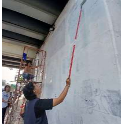
Gambar 7. Anggota tim mahasiswa melakukan pengecatan warna dasar