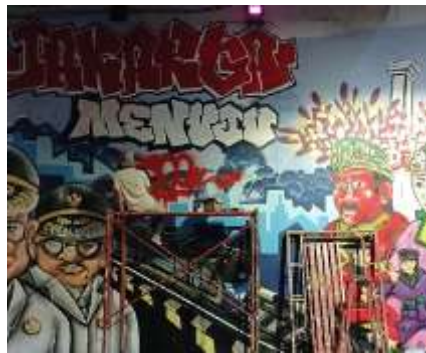
Gambar 11. Anggota tim seniman eksternal menulis tipografi sesuai tema utama