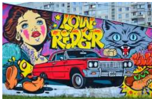
Gambar 3. Ilustrasi karya seni graffiti yang memiliki tema

Secara etimologis, graffiti berasal dari bahasa Italia yaitu " graffire ", yang dapat diartikan sebagai proses menggambar atau menulis huruf di permukaan yang keras seperti dinding (Saputra, Sulaiman, & Nuryati, 2024). Selain itu, ditemukan pendapat lain bahwa kata graffiti menurut Mikke Susanto berasal dari bahasa Italia " graffito " yang berarti goresan atau guratan (Carollina, 2017). Biasanya graffiti ditampilkan dalam bentuk gambar karakter atau teks inisial seniman graffiti, yang pada umumnya hanya dipahami oleh sesama seniman graffiti (Aulia, Wanis, Tiyas, & Sumarwahyudi, 2023). Apabila ditinjau secara mendalam dari segi visual, karya graffiti menggunakan berbagai elemen rupa seperti garis, bentuk, ilustrasi, dan warna, yang turut membentuk bagaimana karya-karya yang dihasilkan dalam wujud graffiti menjadi beragam karya yang memiliki gaya bahasanya masing-masing (Carollina, 2023).