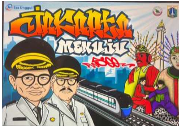
Gambar 6. Hasil akhir sketsa digital konsep karya seni graffiti yang disepakati

memberikan dampak positif secara visual dan emosional terhadap masyarakat lokal di sekitar lokasi sasaran. Setelah melaksanakan tahap diskusi dan eksplorasi ide, tim pelaksana Pengabdian kepada Masyarakat dan pihak mitra menetapkan bahwa unsur budaya lokal Kota Jakarta yang akan diimplementasikan secara visual dalam bentuk karya seni graffiti sebagai upaya memperindah estetika ruang publik di kawasan Kelurahan Duri Kepa Kota Jakarta Barat adalah menampilkan unsur karikatur wajah Gubernur dan Wakil Gubernur DKI Jakarta, yang dikombinasikan dengan ilustrasi siluet gedung, Monumen Nasional (Monas), Patung Pancoran, transportasi umum modern yaitu MRT, beserta ilustrasi ondel-ondel dan pencak silat khas budaya Betawi, dilengkapi oleh penulisan kalimat "Jakarta Menuju 500" yang didominasi oleh warna merah dan putih.