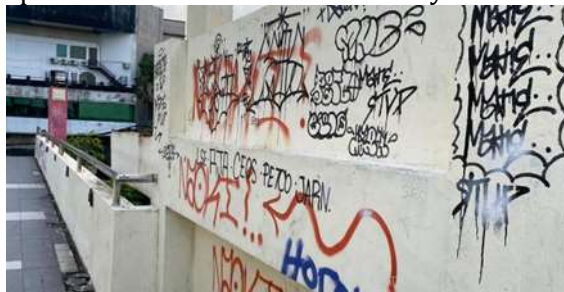
Gambar 1. Ilustrasi perilaku vandalisme yang berkedok graffiti

Sedangkan pada kenyataannya, baik seni graffiti maupun vandalisme merupakan dua hal bertolak belakang, dimana, menurut Kamus Besar Bahasa Indonesia, vandalisme ialah sebuah aksi corat-coret tanpa makna di ruang publik atau di dinding tepi jalan tanpa izin dari pihak yang bersangkutan sehingga bersifat merusak atau menghancurkan karya atau properti orang lain. Hal tersebut tentunya berbeda dengan seni graffiti yang merupakan karya seni yang menekankan pada ilustrasi tulisan atau gambar untuk membangun nilai positif bagi khalayak yang melihat, tanpa adanya niat untuk merusak fasilitas umum serta tidak merusak karya seni visual lainnya. Seperti terlihat pada Gambar 1, contoh ilustrasi yang menunjukkan hasil vandalisme di area publik sehingga merusak tampilan asli tembok dan membuatnya terlihat kumuh.