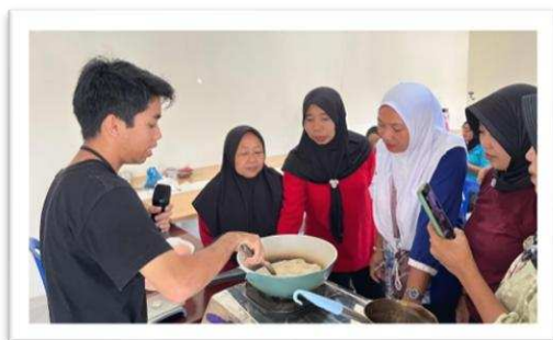
Gambar 2. Proses pelaksanaan pelatihan

Pembentukan karakter religius tidak hanya terjadi melalui penyampaian materi, tetapi melalui role modeling , interaksi sosial, dan budaya kegiatan yang konsisten. Dalam pelatihan ini, instruktur berperan sebagai figur teladan yang memperlihatkan kedisiplinan, kesabaran, dan kebersihan selama proses memasak.