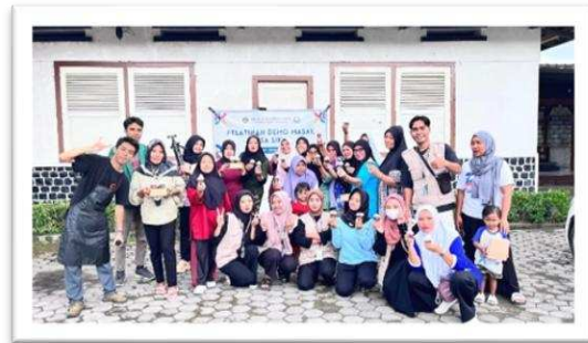
Gambar 3. Foto bersama peserta pelatihan