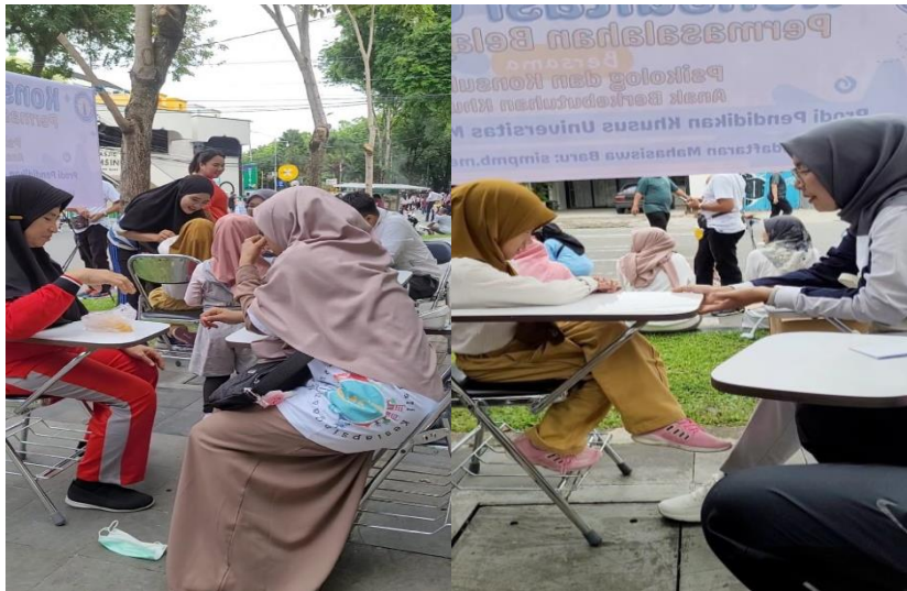
Gambar 2. Kegiatan Pelaksanaan Layanan Konsultasi di Acara Car Free Day Kota Padang