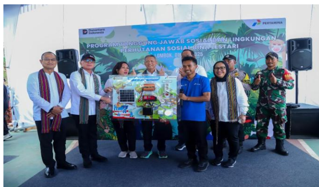
Gambar 5. Inovasi Penggunaan Solar Cell Rumah Produksi

Inovasi lain yang dikembangkan adalah pemanfaatan limbah plastik, khususnya kantong plastik bekas (kresek), melalui teknik tenun menjadi berbagai produk turunan seperti topi, tas, dompet, dan sarung bantal. Produk-produk ini memiliki nilai komersial tinggi dan diproyeksikan sebagai souvenir ramah lingkungan yang menarik bagi wisatawan mancanegara. Strategi diversifikasi produk ini tidak hanya memperluas pangsa pasar, tetapi juga meningkatkan potensi pendapatan masyarakat. Program perhutanan sosial ini juga telah berkontribusi dalam penerapan energi terbarukan melalui pembangunan rumah produksi dengan konsep elektrifikasi solar sel sebagai upaya efisiensi pada penggunaan listrik bagi masyarakat di wilayah hutan Dusun Bongak.