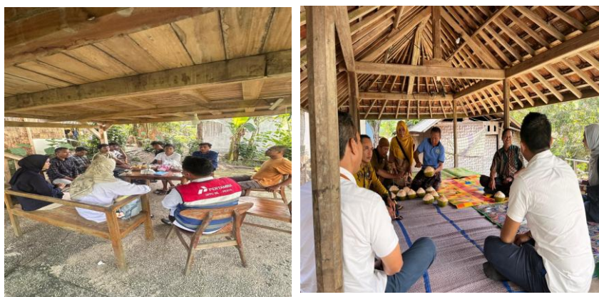
Gambar 4. Focus Group Discussion Kelompok dan Stakeholder