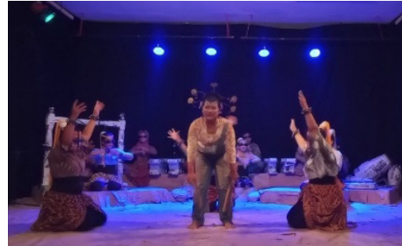
Gambar 5 Pembagian ruang sejarah dan ruang hari ini menggunakan penataan cahaya Dokumentasi Pribadi (November 2021)

bersifat kontemplatif hadir mengiringi kedatangannya di atas panggung untuk menumbuhkan atmosfir yang ritus dalam hal ini musik Tarawangsa dijadikan sebagai ambience yang digunakan.