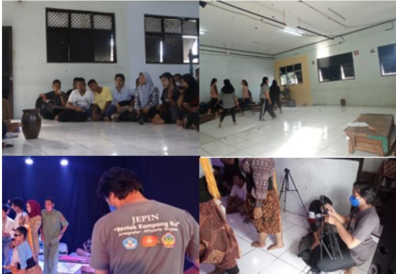
Gambar 6. Proses Latihan Ubrug Kolaboratif Dokumentasi Pribadi (November 2021)

indexical, emotional clue, symbolic voices, epistemic frame, logika subversive, parole urban, serta diksi tontonan. Konsep secara kenaskahan dialog yang hadir merupakan dialog improvisasi yang didasarkan pada sebab akibat dari motif masing-masing tokoh. Pada proses kreatifnya aktor diperintahkan untuk memahami alur cerita yang akan dibangun serta dramatik yang akan dicapai, sehingga masing-masing aktor bersama lawan mainnya mampu berdiskusi guna menemukan kesepakatan dialog. Alasan metode ini digunakan adalah karena metode inilah yang menjadi dasar