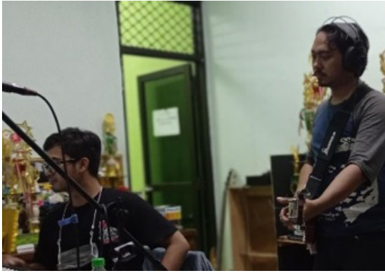
Gambar 4. Proses perekaman audio (November 2021)