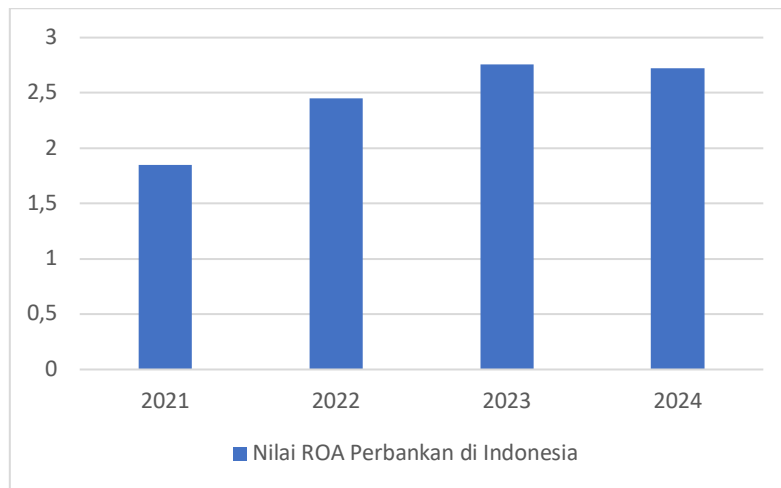
Gambar 1 Nilai ROA Perbankan Konvensional di Indonesia

Pada data Bursa Efek Indonesia (BEI) mencatat bahwa ROA perbankan konvensional meningkat dari 1,85% (2021) ke 2,76% (2023), namun menurun menjadi 2,61% pada pertengahan 2025 (OJK, 2025). Tren ini mengindikasikan ketidakefisienan pengelolaan aset produktif dan strategi manajerial yang belum optimal (Nur Fadilah FH & Puji Muniarty, 2023).