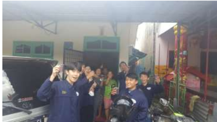
Gambar 1. Keseruan Minum Bersama Produk Liang Teh Gwek An

rumah. Produk Liang Teh Gwek An ini pada awalnya hanyalah Liang Teh pada umumnya hanya memiliki 1 rasa yaitu pahit. Seiring berjalannya waktu, Liang Teh Gwek An ini pun menambah rasa dalam produk Liang Teh nya yaitu rasa manis yang dikarenakan banyak orang yang suka dengan rasa manis. Kapasitas produksi usaha ini masih terbatas, dikarenakan jumlah tenaga kerja produksi hanya 2 (dua) orang saja. Usaha ini adalah usaha yang dijual menggunakan satu stand saja. Usaha tersebut bisa menjual 400-500 gelas perbulan.