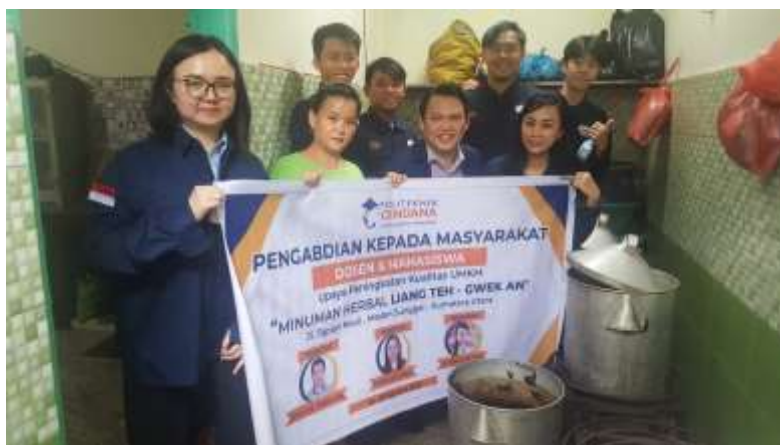
Gambar 2. Lokasi Kegiatan Produksi

Tempat UMKM ini berada di Jalan Perniagaan No.11 Medan. Dimana lokasi tersebut dekat dengan titik tengah kota Medan dan mempunyai pasar yang luas.