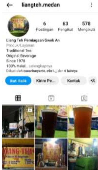
Gambar 3. Bentuk Promosi Lian Teh Gwek An melalui Media Sosial Instagram