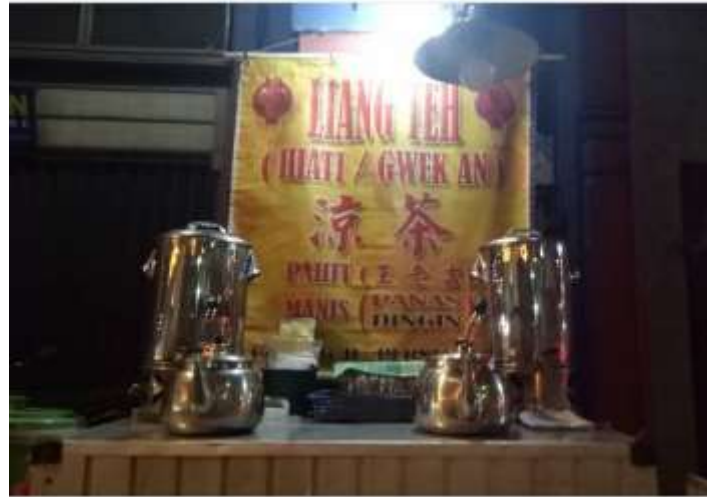
Gambar 5. Bukti Fisik Stand Liang The Gwek An

maka akan semakin banyak calon pelanggan yang tertarik. Tampilan fisik atas Liang Teh Gwek AN ini kita buat semenarik mungkin agar dapat menarik perhatian konsumen. Berikut gambar contoh desain dari produk Liang Teh Gwek An: