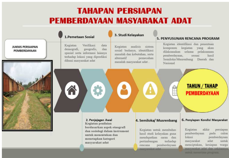
Gambar 4. Tahapan Persiapan Pemberdayaan Masyarakat Adat

Melalui kegiatan ini, pengurus Yayasan PAPEDA dibekali pemahaman mendalam terkait dengan tahapan persiapan yang harus dilakukan dalam melaksanakan kegiatan pemberdayaan KAT. Adapun tahapan tersebut diantaranya: