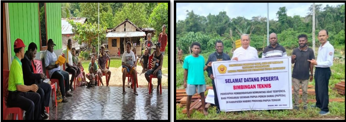
Gambar 3. Kegiatan Sosialisasi dan Bintek Persiapan PKAT di Suku Yaur

Melalui kegiatan ini, pengurus Yayasan PAPEDA dibekali pemahaman mendalam terkait dengan tahapan persiapan yang harus dilakukan dalam melaksanakan kegiatan pemberdayaan KAT. Adapun tahapan tersebut diantaranya: