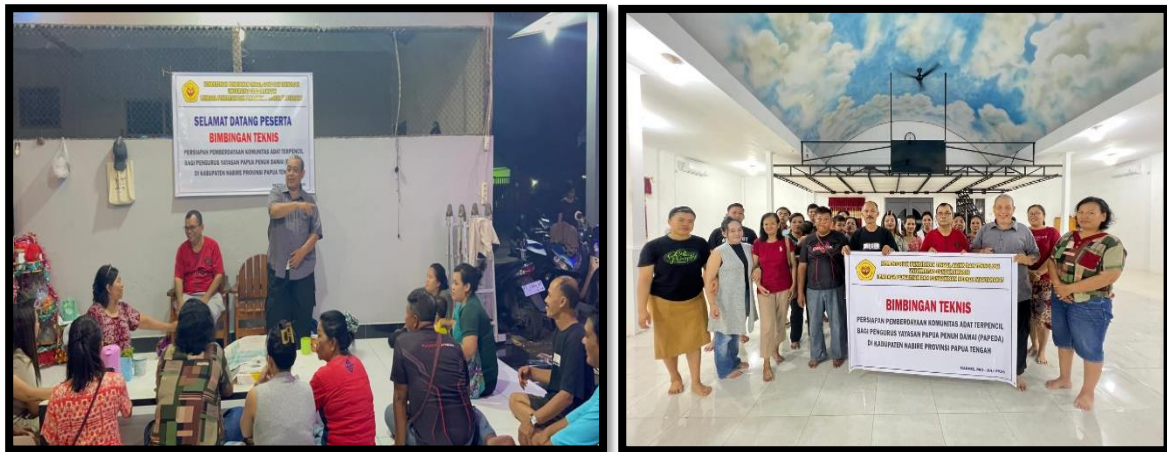
Gambar 2. BIMTEK Pengurus Yayasan PAPEDA

Kegiatan BIMTEK dilaksanakan di kantor Yayasan PAPEDA dengan dihadiri oleh pengurus yayasan dan turut berpartisipasi secara aktif dengan berbagi pengalaman dan memperdalam pemahaman mengenai pemberdayaan komunitas adat. Berikut hasil dokumentasi pemaparan materi pada kegiatan BIMTEK di Yayasan PAPEDA.