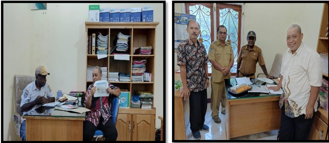
Gambar 1. Sharing Session di Dinas Sosial

sharing session (sesi berbagi) dengan staf dan juga dilakukan di Yayasan PAPEDA, serta dilaksanakan di lingkungan suku Yaur.