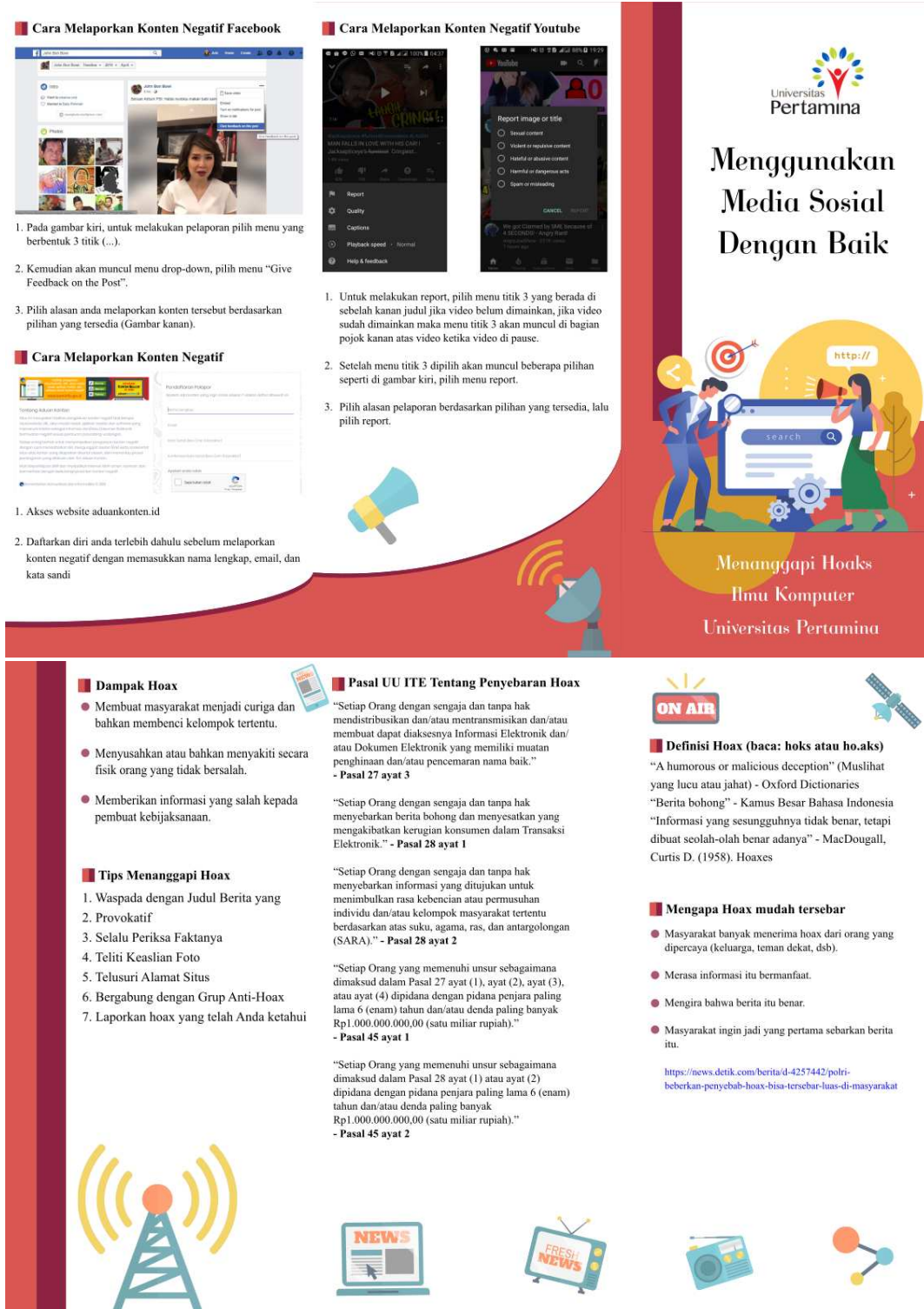
Gambar 3. Booklet Sosialisasi Penggunaan Sosial Media yang Baik dan Benar