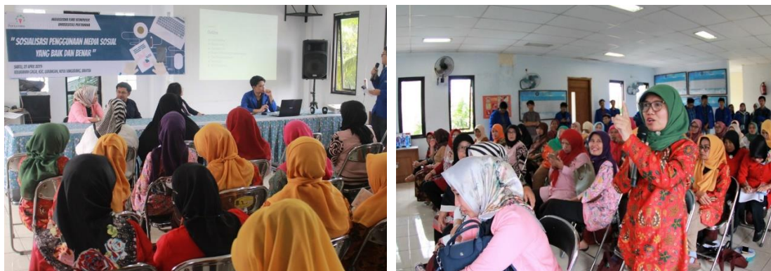
Gambar 4. Dokumentasi Pelaksanaan Sosialisasi

Kegiatan pengabdian kepada masyarakat dengan topik peningkatan literasi digital sebaiknya terus dilakukan di area-area lainnya baik untuk masyarakat pada rentang usia 45-65 tahun maupun kelompok usia 18-29 tahun. Jika orang tua rentan terhadap berita palsu, kelompok usia yang lebih muda yang jauh lebih aktif menggunakan sosial media rentan terpapar cyberbullying . Selain itu, rendahnya kesopanan pengguna internet Indonesia yang didominasi oleh masyarakat kelompok usia muda mendorong perlunya peningkatan literasi digital dalam hal kemampuan menulis yang berhubungan dengan informasi yang didapat melalui media berformat digital (internet-based media, website, social media) dan etika dalam bersosial media.