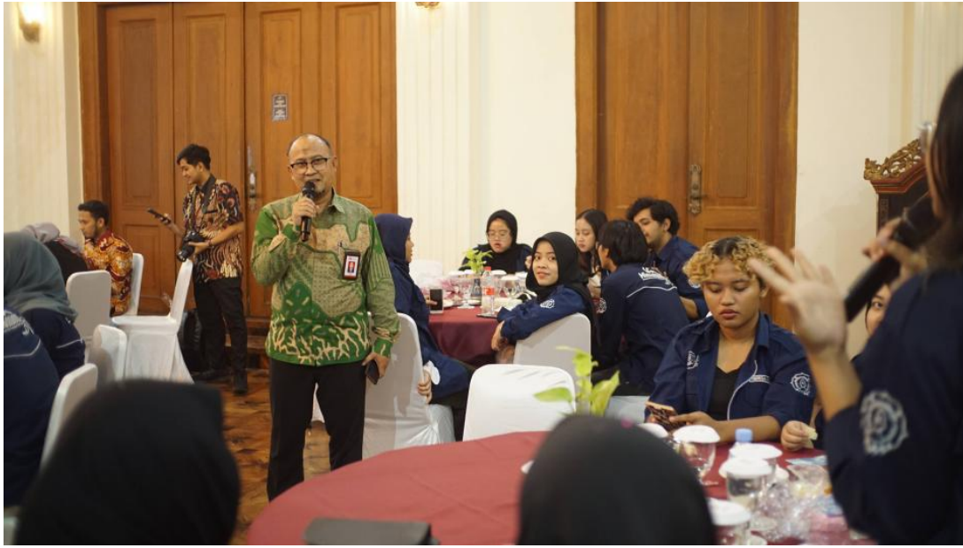
Gambar 4. Materi dari Perwakilan OJK Solo

Setelah membahas karakteristik fintech , Bapak Heri melanjutkan pemaparannya dengan menjelaskan beberapa permasalahan yang sering meresahkan masyarakat. Terdapat tiga isu utama yang menjadi perhatian. Pertama, fintech legal tidak diizinkan mengirimkan penawaran pinjaman daring yang dikirim dari nomor ponsel pribadi. Kedua, masyarakat harus mewaspadaai praktik pengiriman dana pinjaman tanpa pengajuan resmi. Sesuai dengan regulasi OJK, dana pinjaman hanya dapat diberikan kepada individu yang telah mengajukan permohonan secara resmi. Oleh karena itu, jika seseorang menerima dana tanpa pengajuan, hal tersebut patut dicurigai. Ketiga, maraknya fintech ilegal yang meniru nama fintech berizin untuk menipu masyarakat. Guna menghindari hal ini, masyarakat disarankan melakukan pengecekan berkala terhadap daftar fintech resmi yang diterbitkan oleh OJK.