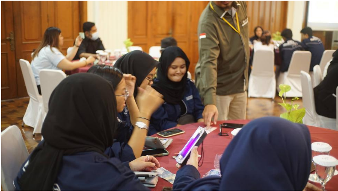
Gambar 3. Materi Pengenalan Keaslian Uang

Selain membahas manfaat QRIS, narasumber juga memberikan pemaparan mengenai langkah-langkah menjaga keamanan dalam bertransaksi menggunakan QRIS. Beberapa langkah yang disarankan antara lain memastikan bahwa nama yang tertera di aplikasi QRIS sesuai dengan nama tempat bertransaksi, mengingat semakin maraknya kasus penyalahgunaan QRIS untuk kepentingan lain. Bagi pelaku usaha dan UMKM, disarankan untuk melakukan pengecekan transaksi secara berkala guna memastikan keaslian QRIS yang digunakan. Jika terjadi kendala dalam transaksi, pengguna dianjurkan untuk segera melaporkannya kepada penyedia jasa pembayaran agar sistem QRIS dapat diperiksa dan ditindaklanjuti dengan cepat. Sesi ini kemudian ditutup dengan tambahan materi mengenai cara mengenali keaslian uang kertas sebagai alat pembayaran resmi, yang menjadi bagian penting dalam literasi keamanan finansial.