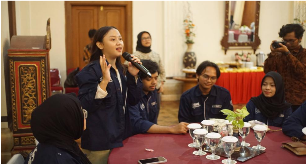
Gambar 5. Sesi Tanya Jawab dengan Peserta

Sesi pemaparan materi dari kedua narasumber diakhiri dengan sesi tanya jawab yang interaktif. Beberapa peserta mengajukan pertanyaan terkait kebocoran data dan langkah-langkah mitigasi yang dilakukan OJK, pemalsuan data oleh peminjam dalam sistem fintech , serta perkembangan dan rencana ke depan terkait implementasi QRIS. Kedua narasumber memberikan jawaban yang komprehensif untuk menjelaskan setiap isu yang diajukan. Acara literasi finansial ini kemudian ditutup dengan pemberian kenang-kenangan berupa sertifikat kepada masing-masing narasumber sebagai bentuk apresiasi atas kontribusi mereka dalam memberikan edukasi kepada peserta.