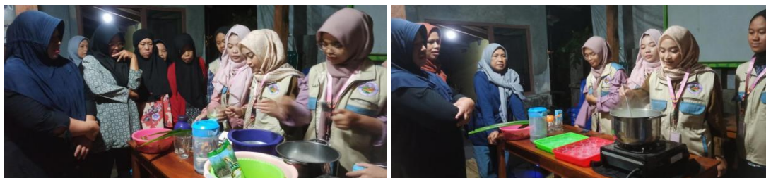
Gambar 3. Pelatihan Pembuatan Puding Daun Kelor di Dusun Ngireng-Ireng