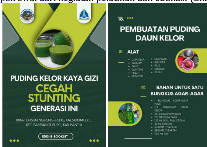
Gambar 2. Media Booklet Puding Daun Kelor dan Stunting

Data penyuluhan dan pelatihan dikumpulkan menggunakan metode observasi partisipatif , wawancara informal , dan dokumentasi kegiatan berupa foto dan catatan lapangan. Selain itu, kuisisioner singkat juga dibagikan untuk mengevaluasi tingkat pemahaman peserta sebelum dan sesudah kegiatan edukasi (Kharisna et al. , 2024). Data yang terkumpul dianalisis secara deskriptif kualitatif untuk menggambarkan proses, partisipasi, dan dampak awal dari kegiatan pelatihan dan edukasi (Ekasari et al. , 2024).