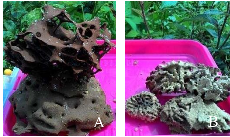
Gambar 1. Dua jenis konstruksi pada termitarium M. gilvus . Hagen Tanah sarang rayap/TS (A), fungus comb /F (B).