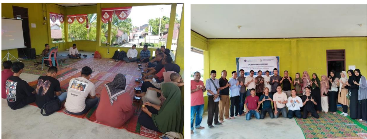
Gambar 2. Pelaksanaan Pengabdian Kepada Masyarakat

Berikut adalah dokumentasi berupa foto kegiatan Peningkatan Pemahaman Hukum Masyarakat Tentang Dispensasi Kawin Guna Menjamin Perlindungan Hukum Bagi Anak: