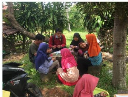
Gambar 4. Kegiatan diluar sekolah pada anak

Hasil sosialisasi yang diberikan pada siswa bisa menjadikan pemahaman pada siswa dapat memahami bahaya dalam penggunaan gadget yang berlebihan. Maka dari itu hasil yang dicapai dari program sosialisasi bahaya gadget pada siswa SDN 50 Kota Bengkulu, anak – anak sudah dapat mengurangi aktivitas bermain gadget, bahkan berdasarkan hasil questioner serta observasi terhadap lingkungan sekitar sekolah banyak dari anak-anak sekarang lebih mengikuti kegiatan TPA di masjid, dimana pada saat melakukan observasi kami pun terlibat dalam membantu melaksanakan kegiatan yang positif dan dapat bersosialisasi.