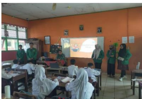
Gambar 2. Pemutaran video sosialisasi pada anak