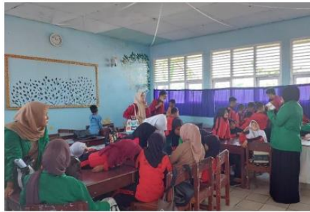
Gambar 3. Dampak hasil sosialisasi

Hasil sosialisasi yang diberikan pada siswa bisa menjadikan pemahaman pada siswa dapat memahami bahaya dalam penggunaan gadget yang berlebihan. Maka dari itu hasil yang dicapai dari program sosialisasi bahaya gadget pada siswa SDN 50 Kota Bengkulu, anak – anak sudah dapat mengurangi aktivitas bermain gadget, bahkan berdasarkan hasil questioner serta observasi terhadap lingkungan sekitar sekolah banyak dari anak-anak sekarang lebih mengikuti kegiatan TPA di masjid, dimana pada saat melakukan observasi kami pun terlibat dalam membantu melaksanakan kegiatan yang positif dan dapat bersosialisasi.