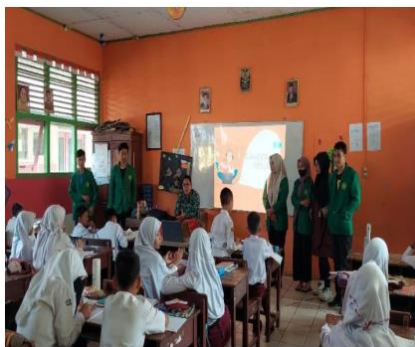
Gambar 1. Sosialisasi Kepada Murid Sekolah Dasar

Dengan memberikan sosialiasi ini didapatkan hasil bahwa anak-anak dapat menyikapi dan sangat antusias dalam mengikuti acara sosialiasasi ini, juga dapat memberikan pemahaman kepada anak bahwa kegiatan lain yang dapat dilakukan selain bermain gadget sangatlah banyak tingkat positifnya, dan juga lebih membuat anak-anak berani dalam bersosialisasi.