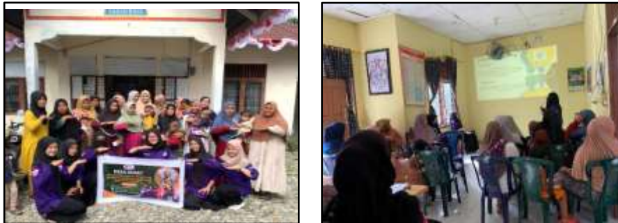
Gambar 1. Kegiatan sosialisasi pemberian makanan bergizi kepada anak

Keberhasilan kegiatan sosialisasi ini tidak terlepas dari peran aktif aparat Gampong dan para kader posyandu yang turut mendukung penyebaran informasi secara luas. Para kader posyandu berperan sebagai fasilitator yang membantu memastikan para ibu mendapatkan informasi yang tepat dan mendampingi mereka dalam menerapkan pengetahuan yang telah diperoleh di rumah masing-masing. Selain itu, kolaborasi yang baik antara aparat desa dan kader posyandu menjadi faktor kunci dalam menjamin keberlanjutan program ini, sehingga dapat memberikan dampak positif bagi kesehatan anak di lingkungan tersebut. Diharapkan, dengan adanya sosialisasi yang terstruktur dan dukungan dari berbagai pihak, prevalensi stunting di daerah tersebut dapat berkurang secara signifikan.