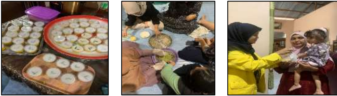
Gambar 2. Pembuatan dan Distribusi Pemberian Makanan Tambahan (PMT) kepada Balita