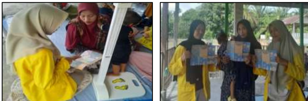
Gambar 3. Penyebaran Brosur tentang pencegahan stunting

Informasi yang disampaikan dalam brosur ini dirancang dengan jelas dan rinci, dengan tujuan untuk meningkatkan kesadaran serta pengetahuan masyarakat terkait upaya pencegahan stunting melalui penerapan PHBS dalam kehidupan sehari-hari. Diharapkan, dengan penyebaran brosur ini, masyarakat dapat lebih memahami langkah-langkah preventif yang diperlukan untuk menjaga kesehatan balita dan mencegah terjadinya stunting.