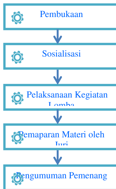
Gambar 2 Metode pelaksanaan kegiatan porseni

Pengumuman akan diinformasikan langsung di hari itu juga setelah semua rekap dari 3 juri dilakukan. Sistem penilaian dilakukan secara transparan dengan ketentuan yang sudah dijelaskan. Nilai yang didapat juga akan di informasikan secara langsung kepada peserta supaya hasil yang didapatkan bisa dilihat secara transparan.