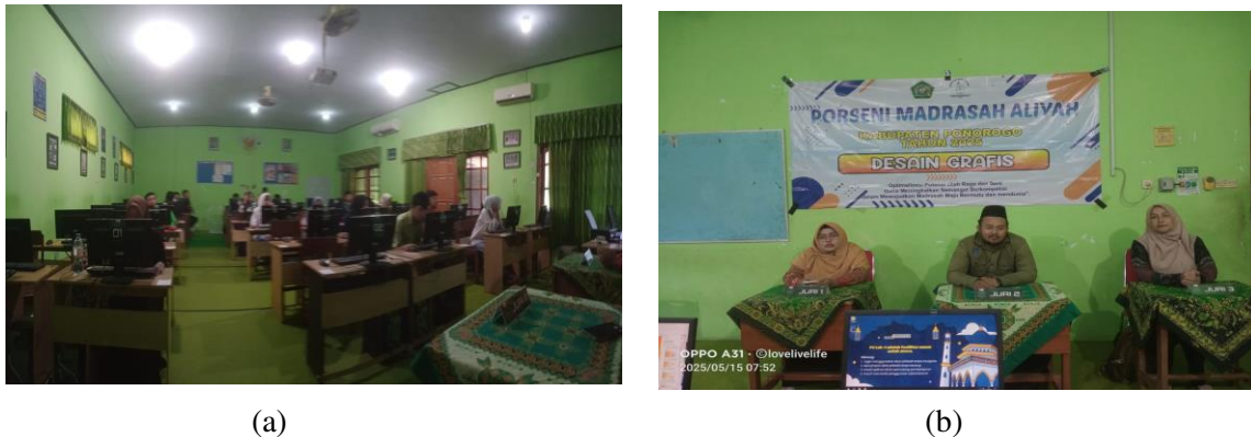
Gambar 4 (a) Kegiatan lomba desain grafis Porseni di MAN 1 Ponorogo dan (b) Kegiatan lomba Desain Grafis Porseni di MAN 1 Ponorogo

Berikut adalah bukti kegiatan yang dilakukan dalam kegiatan porseni tertera pada Gambar 4.