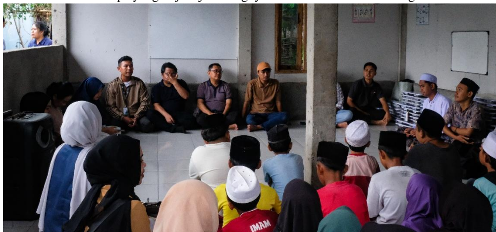
Gambar 3. Sosialisasi Literasi Keuangan dengan Pendekatan Storytelling

berlebih atau top-up game online, versus impiannya membeli perlengkapan sekolah baru. Selama sesi bercerita, tim secara aktif melontarkan pertanyaan pemantik kepada anak-anak, seperti "Apakah mainan ini benar-benar dibutuhkan hari ini?" atau "Apa yang terjadi jika uangnya dihabiskan semua sekarang?"