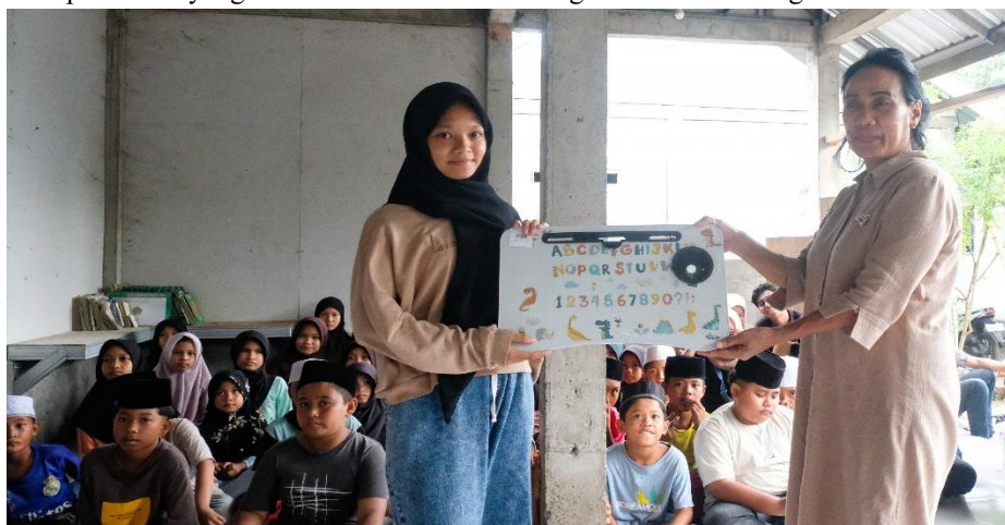
Gambar 4. Apresiasi Peserta

Tahap terakhir diisi dengan evaluasi ringan, afirmasi positif, dan pemberian apresiasi. Tim pengabdian mengajak anak-anak duduk bersama untuk merefleksikan kembali moral dari cerita yang telah disampaikan. Mayoritas anak-anak dapat menyimpulkan dengan bahasa mereka sendiri bahwa menyisihkan uang jajan untuk ditabung adalah perbuatan yang hebat dan membantu meringankan beban orang tua.