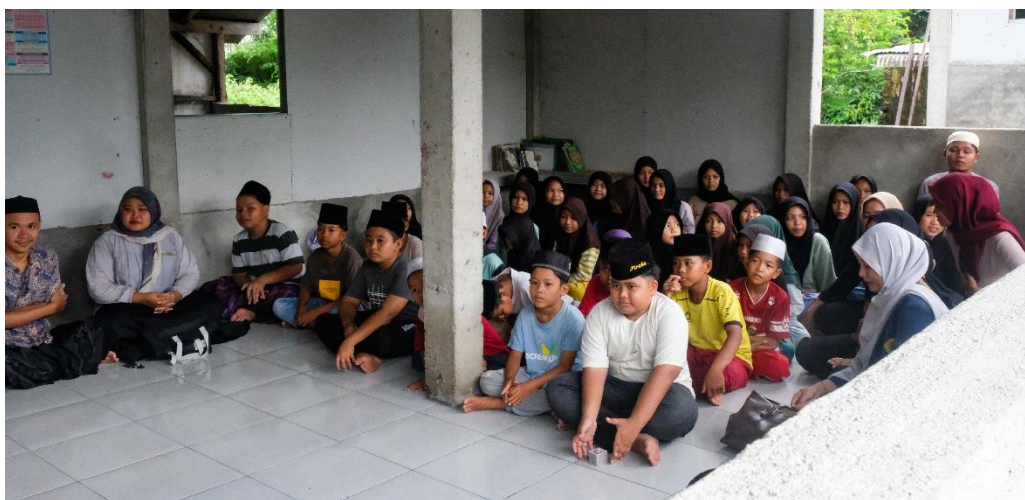
Gambar 2. Pengkondisian Peserta

Tahap pra kondisi terbukti menjadi fondasi krusial dalam keberhasilan seluruh rangkaian acara. Pada awalnya, anak-anak santri cenderung menunjukkan sikap pemalu dan pasif, mengingat kehadiran tim pengabdian dianggap sebagai sosok asing di lingkungan mereka. Namun, melalui serangkaian permainan edukatif ( ice breaking ) yang melibatkan aktivitas fisik dan konsentrasi dasar tentang angka, ketegangan psikologis tersebut berhasil dicairkan.