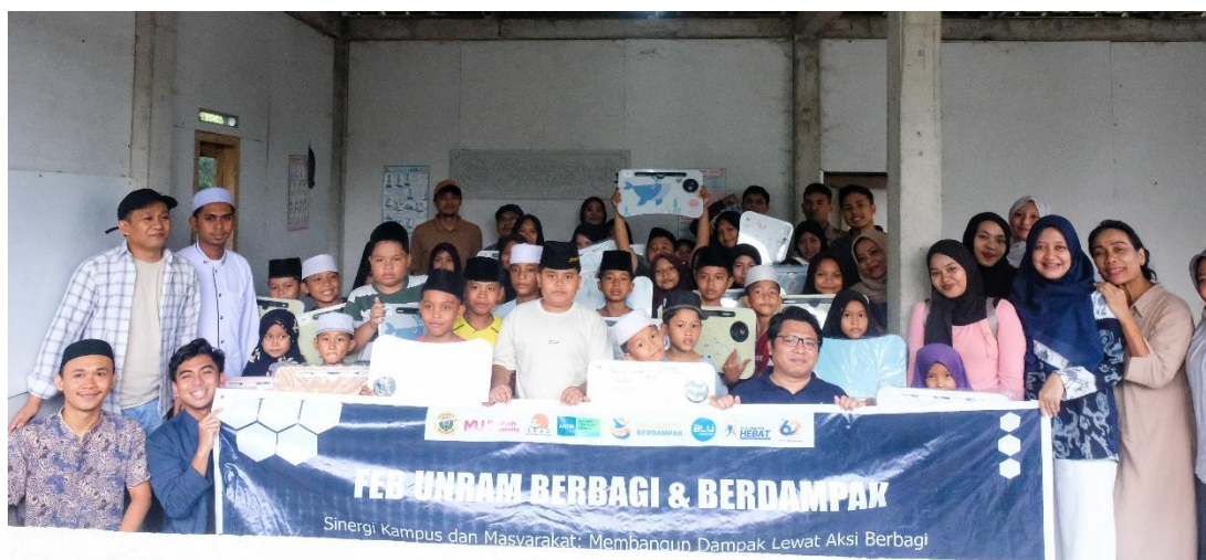
Gambar 5. Foto Bersama Tim Pengabdian dengan Peserta

symbol bahwa anak-anak harus belajar dengan sungguh-sungguh, termasuk belajar soal bagaimana mengelola uang yang dimiliki.