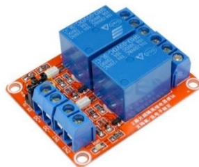
Gambar 6. Modul Relay

Relai adalah sakelar yang dioperasikan secara elektrik dan komponen elektromekanis yang terdiri dari dua bagian utama, elektromagnetik dan mekanis. Relai menggunakan prinsip elektromagnetik untuk mengontrol kontak switching sehingga dengan arus kecil (daya rendah) dapat menghantarkan listrik pada tegangan yang lebih tinggi. [11].