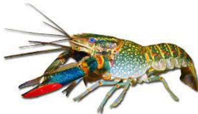
Gambar 1. Lobster Air Tawar

Lobster air tawar merupakan komoditas perikanan yang bernilai ekonomis dan dibudidayakan secara besar-besaran. Lobster air tawar ( Cherax quadricarinatus ) merupakan spesies udang yang tersebar luas di Indonesia dan negara lain seperti Australia, Amerika dan Inggris [1]. Red Claw Red Claw