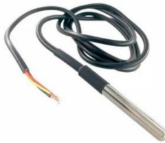
Gambar 2. Sensor Suhu DS18B20

Sensor DS18B20 adalah sensor untuk pendeteksi suhu dan tahan air. Keluaran dari sensor DS18B20 berupa data digital. Fitur sensor ini antara lain digunakan pada tegangan 3-5V, error akurasi \pm 0,5^{\circ}\text{C} dengan rentang suhu dari -10^{\circ}\text{C} hingga 85^{\circ}\text{C} , kabel merah pada sensor DS18B20 untuk VCC, kabel hitam pada sensor DS18B20 untuk GND, kabel kuning pada sensor DS18B20 untuk data, diameter kawat 4mm dengan panjang 90cm [6].