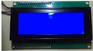
Gambar 4. LCD I2C

LCD I2C adalah garis dengan fungsi menampilkan hasil pemantauan waktu nyata. LCD (Liquid Crystal Display) adalah salah satu alat untuk menampilkan komponen elektronik dengan menggunakan kristal cair [8]. LCD ( Liquid Crystal Display ) digunakan untuk menampilkan informasi elektronik seperti teks (huruf), angka atau simbol [9].