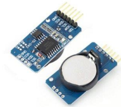
Gambar 5. Real Time Clock DS3231

RTC (Real Time Clock) adalah sebuah chip (IC) dengan fungsi menyimpan tanggal dan waktu. DS3231 adalah real-time clock (RTC) yang menggunakan jalur data paralel. Dapat menyimpan data valid detik, menit, jam, hari, bulan, hari dalam seminggu dan tahun, hingga 2100 [10].