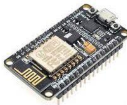
Gambar 3. NodeMCU ESP8266

NodeMCU ESP8266 adalah modul yang menyertakan mikrokontroler NodeMCU dan ESP8266. Di board ini, NodeMCU dan ESP8266 ditempatkan langsung di tempat yang sama sehingga kita tidak