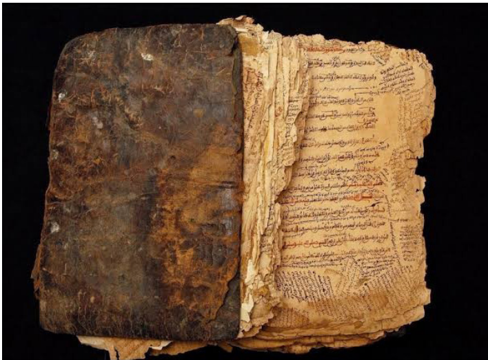
Gambar 1. Naskah Wangsakerta Koleksi Museum Nasional Indonesia (Dokumentasi: http://naskahwangsakerta.wikipedia.org.com .)

Dalam penggalan Naskah Wangsakerta, masa atau zaman Nirleka dimaknai sebagai “masa yang dihuni oleh para raksasa dan siluman (makhluk setengah manusia setengah binatang) yang hidup dengan cara perang tanding, memakan semua binatang dan tumbuhan, tidak berperikemanusiaan, mahir dalam hal mantra, memiliki daya kadugalan dan daya kanuragan , kanibal, dan ambisius. Pada masa ini manusia telah hadir dan kehidupannya terus menerus diteror oleh wangsa siluman sehingga menjadi musuh bebuyutan.”