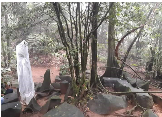
Gambar 4. Area Sakral Situs Kabuyutan Arya Salingsing, Dayeuh Luhur Cilacap

Pada fase selanjutnya adalah langkah memahami konsep kosmologi Sunda melalui ranah Kabuyutan . Kabuyutan bisa juga disebut sebagai Mandala yang memiliki arti daerah sakral, karena di situ hadir daya-daya transenden langit dan bumi di tengah-tengah umat manusia. Kabuyutan atau Mandala berarti bersatunya langit (air), bumi (tanah), dan batu sebagai simbol manusia. Mandala ini juga erat sekali dengan Kabuyutan . Buyut dapat berarti “tabu”, terlarang, eksklusif, tidak sembarang orang boleh masuk. Tetapi sekaligus juga dapat berarti “nenek moyang” atau embah buyut. Dalam setiap kabuyutan selalu terdapat tiga unsur kosmologi Sunda, yakni langit, bumi dan dunia manusia. Simbol-simbolnya adalah air untuk langit, tanah untuk bumi (berhutan), dan batu untuk manusia (Sumardjo, 2011: 76-77).