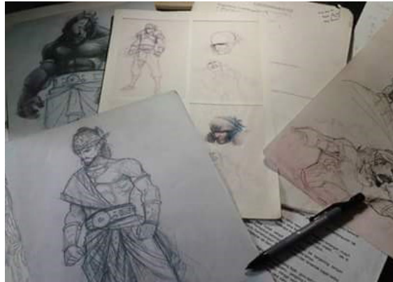
Gambar 9. Beberapa Tampilan Visual Desain Karakter Tokoh-tokoh Ksatria

Sunda dan dari pantun, tampilan bentuk tubuh dan busana yang dikenakan oleh ksatria bangsa manusia dan sosok-sosok horor dari bangsa siluman.