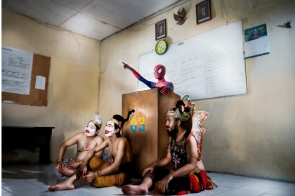
Gambar 2. Foto karya penulis (Sukmawati, 2021)

menjadi sebuah analogi bahwa masyarakat Indonesia sudah terpapar oleh budaya populer dari Barat yang mengakibatkan padamnya pengetahuan dan kepedulian masyarakat pada budaya sendiri yang digambarkan melalui tokoh wayang.