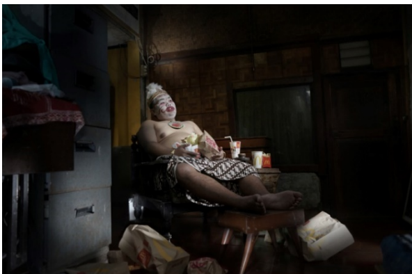
Gambar 4. Foto karya penulis (Sukmawati, 2021)

Pada karya foto di gambar 3, terlihat karakter Gareng mengangkat sebuah televisi yang menampilkan tokoh Spider-Man yang berpose bak mencibir. Foto ini merupakan sebuah analogi budaya nusantara seolah direndahkan dan dianggap sepele dengan kehadiran budaya asing. Hal ini menggambarkan fenomena di mana antusiasme masyarakat terhadap budaya nusantara semakin rendah, bahkan terancam pudar.