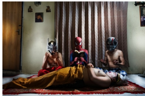
Gambar 1. Foto karya penulis (Sukmawati, 2021)

Penulis mencoba untuk membuat lompatan-lompatan nilai pada komposisi yang dihadirkan pada karya, dengan karakter superhero asing mendominasi karya yang dihadirkan dengan tafsir bahwasanya budaya asing sudah bias dan mengikis budaya-budaya yang ada.