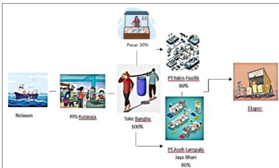
Figure 1. Tuna supply chain at PPS Kutaraja, Lampulo, Banda Aceh

Struktur supply chain ikan tuna di PPS Kutaraja sangat dibutuhkan untuk menjamin keberhasilan distribusi produk secara tepat, baik serta kuantitas maupun kualitas. Secara umum, pelaku supply chain ikan tuna di PPS Kutaraja terdiri dari nelayan, pengumpul ( toke bangku ), supplier, pengecer. Salah satu faktor kunci dalam penentuan proses pengendalian mutu adalah rantai pasok ( supply chain ), yang melibatkan distribusi barang dari produksi ikan di atas kapal hingga produk diterima oleh perusahaan (Gambar 1). Penanganan produk pada tiap tahap distribusi ini merupakan titik kritis yang akan mempengaruhi mutu produk tuna loin ketika sampai di perusahaan dan dilakukan proses sortasi mutu ( grading ) (Jati et al , 2014).