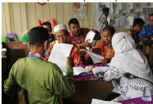
Gambar 3. Peserta Berdiskusi Menyelesaikan Kasus Pembelajaran Berdiferensiasi

Ada lima kelompok yang menyampaikan pendapat hasil diskusi kelompoknya masing-masing. Rata-rata dari setiap kelompok sudah dapat merancang scenario pembelajaran berdiferensiasi dengan situasi dan kondisi hasil asesmen diagnostic awal sebagai bahan pemetaan dan penyusunan