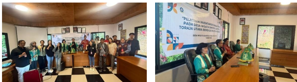
Gambar 1. Tim PKM Bersama Para Peserta

Gambar ini memperlihatkan momen kebersamaan antara tim PKM dengan peserta pelatihan di Balai Desa Sangbua. Kehadiran tim pendamping sangat penting untuk mendukung proses transfer pengetahuan dan membangun semangat kolaborasi di antara warga dalam mengelola potensi wisata secara bersama.