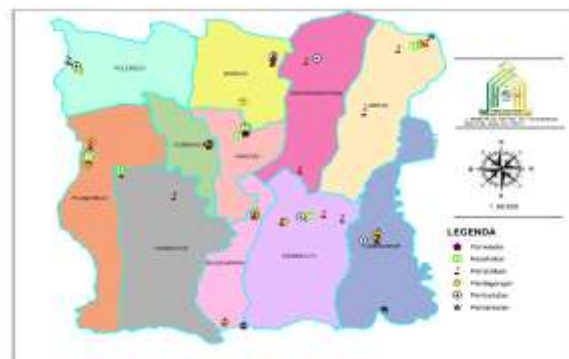
Gambar 4. Peta Titik Pusat Kegiatan

Di Kecamatan Bakung, pusat-pusat kegiatan masyarakat memiliki peran penting dalam mendukung aktivitas sosial dan ekonomi. Pusat kegiatan ini mencakup fasilitas pendidikan, kesehatan, religi, pariwisata serta ekonomi seperti pasar Lorejo, sebagai salah satu pusat kegiatan utama, sering menjadi lokasi lonjakan mobilitas masyarakat. Keberadaan pusat-pusat kegiatan ini menyebabkan pergerakan harian masyarakat meningkat, terutama saat jam-jam sibuk. Lonjakan mobilitas yang tercermin dari tingginya nilai LHR dapat memperburuk kondisi jalan.