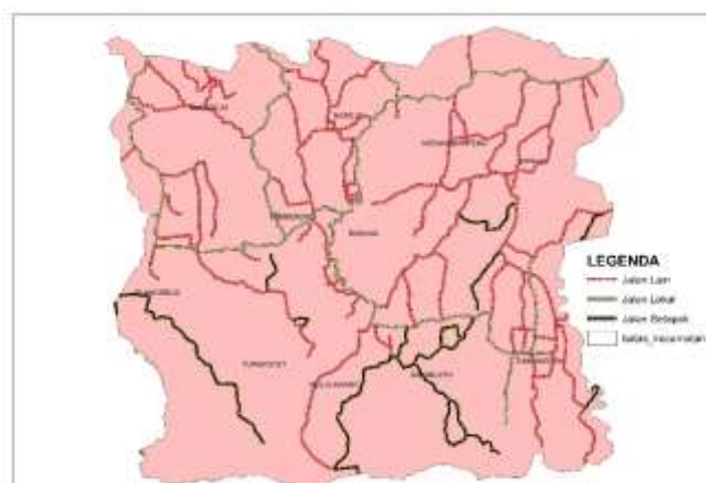
Gambar 6. Peta Jalan

Pengaruh kerusakan jalan terhadap pola mobilitas di timur Pasar Lorejo sepanjang 1 km dengan tingkat kerusakan 35% (sekitar 350 meter) memberikan dampak yang signifikan terhadap pola mobilitas penduduk, terutama di kawasan dengan aktivitas ekonomi tinggi seperti Pasar Lorejo, Kecamatan Bakung. Dampak tersebut meliputi penurunan aksesibilitas akibat jalan berlubang, retak, dan permukaan bergelombang yang menyulitkan akses ke pasar, sekolah, dan fasilitas kesehatan, sehingga masyarakat cenderung mencari jalur alternatif atau menunda perjalanan. Selain itu, kerusakan jalan menyebabkan peningkatan waktu tempuh dari rata-rata 8 menit menjadi 15 menit, disertai data kecelakaan dari BPS tahun 2023 yang mencatat 7 kejadian dengan 2 korban meninggal dunia dan 5 luka ringan. Kondisi ini memicu perubahan rute mobilitas, di mana masyarakat menghindari ruas jalan rusak dan beralih ke jalur alternatif yang tidak dirancang menampung volume lalu lintas besar, sehingga menimbulkan kepadatan baru dan penurunan tingkat pelayanan jalan. Permukaan jalan yang tidak rata, minim rambu dan pencahayaan juga meningkatkan risiko kecelakaan, terutama saat malam atau musim hujan. Secara ekonomi dan sosial, hambatan mobilitas ini mengganggu distribusi barang, meningkatkan biaya operasional, menurunkan aktivitas perdagangan, dan dalam jangka panjang dapat mengurangi produktivitas masyarakat serta mendorong migrasi ke wilayah dengan infrastruktur yang lebih baik.