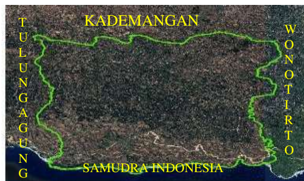
Gambar 1. Lokasi Penelitian (Kecamatan Bakung)

Penelitian ini menggunakan pendekatan kuantitatif dengan metode analisis deskriptif. Fokus utama adalah mengukur dan menganalisis kapasitas serta tingkat kerusakan jalan di Kecamatan Bakung, khususnya di kawasan Pasar Lorejo. Data primer dikumpulkan melalui survei lalu lintas untuk menghitung volume kendaraan dan observasi langsung untuk mengidentifikasi kerusakan jalan dan pola mobilitas. Data sekunder diperoleh dari citra satelit, data BPS mengenai kepadatan penduduk, dan jurnal terkait. Analisis data dilakukan dengan menggunakan Manual Kapasitas Jalan Indonesia (MKJI) 1997 dan perhitungan Lintas Harian Rata-Rata (LHR).